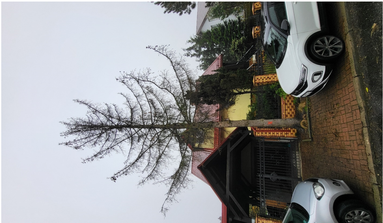
Dokumentacja fotograficzna drzewa