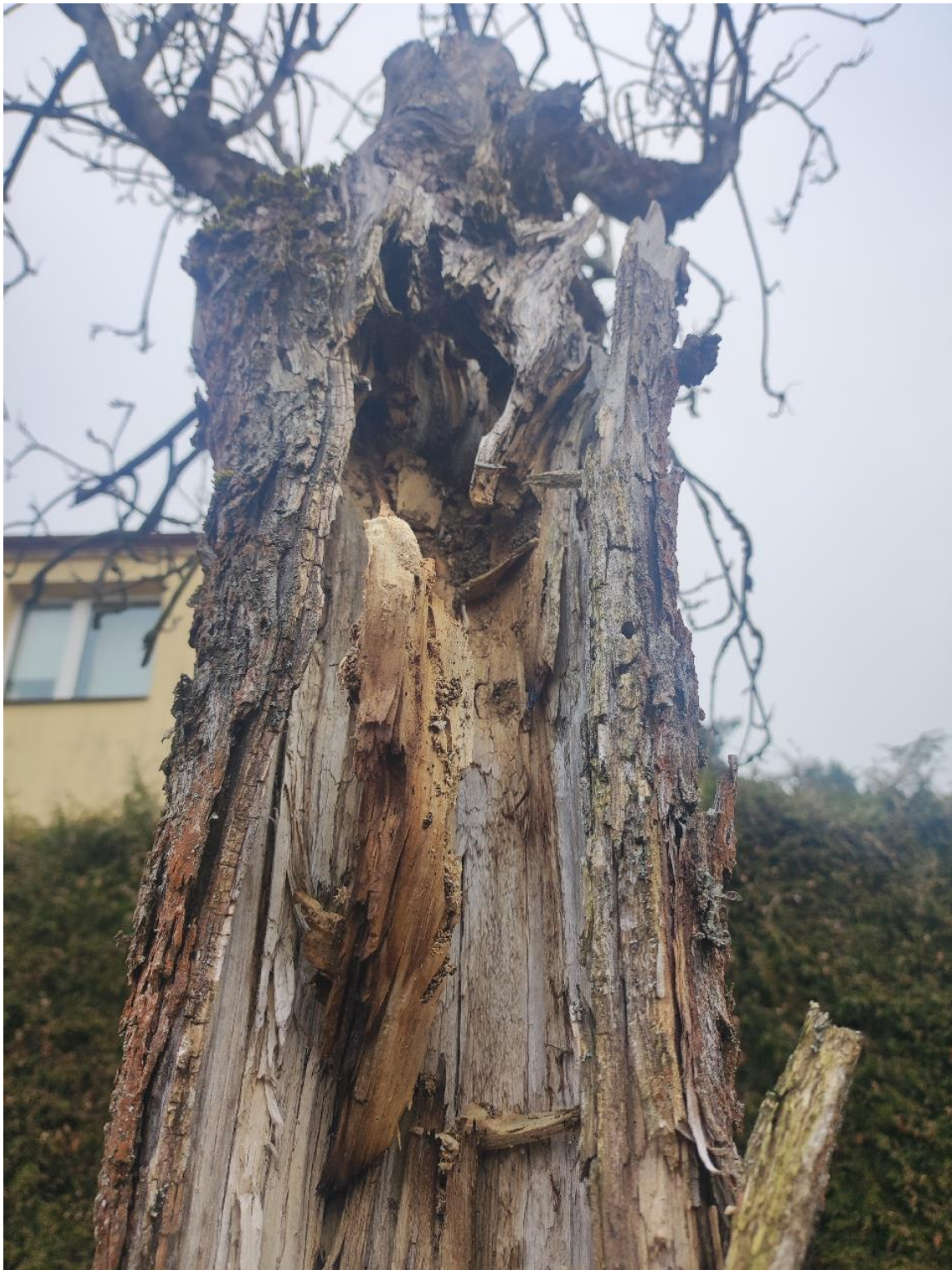
Dokumentacja fotograficzna drzewa nr 2