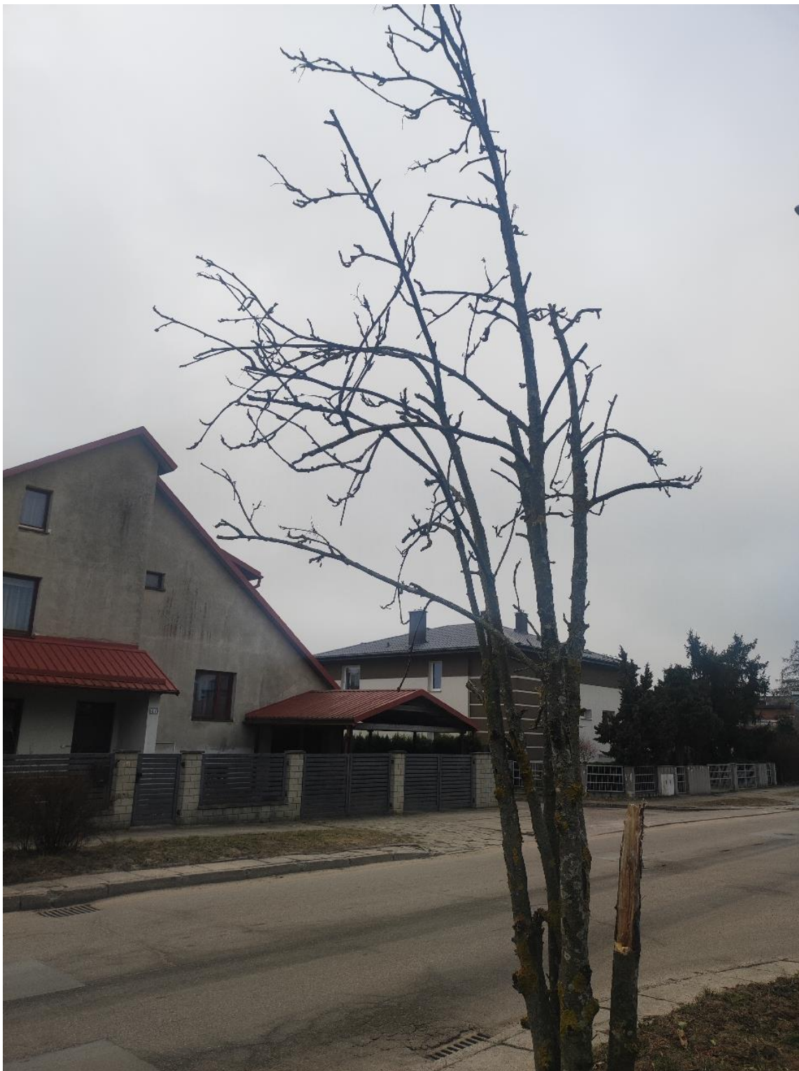
Dokumentacja fotograficzna drzewa nr 1