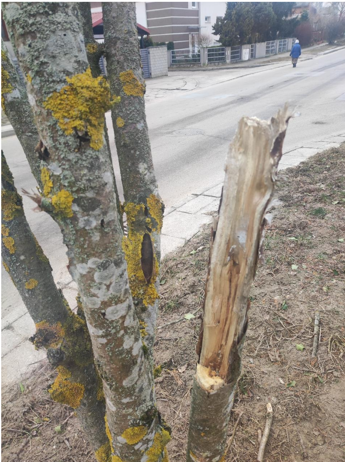
Dokumentacja fotograficzna drzewa nr 1