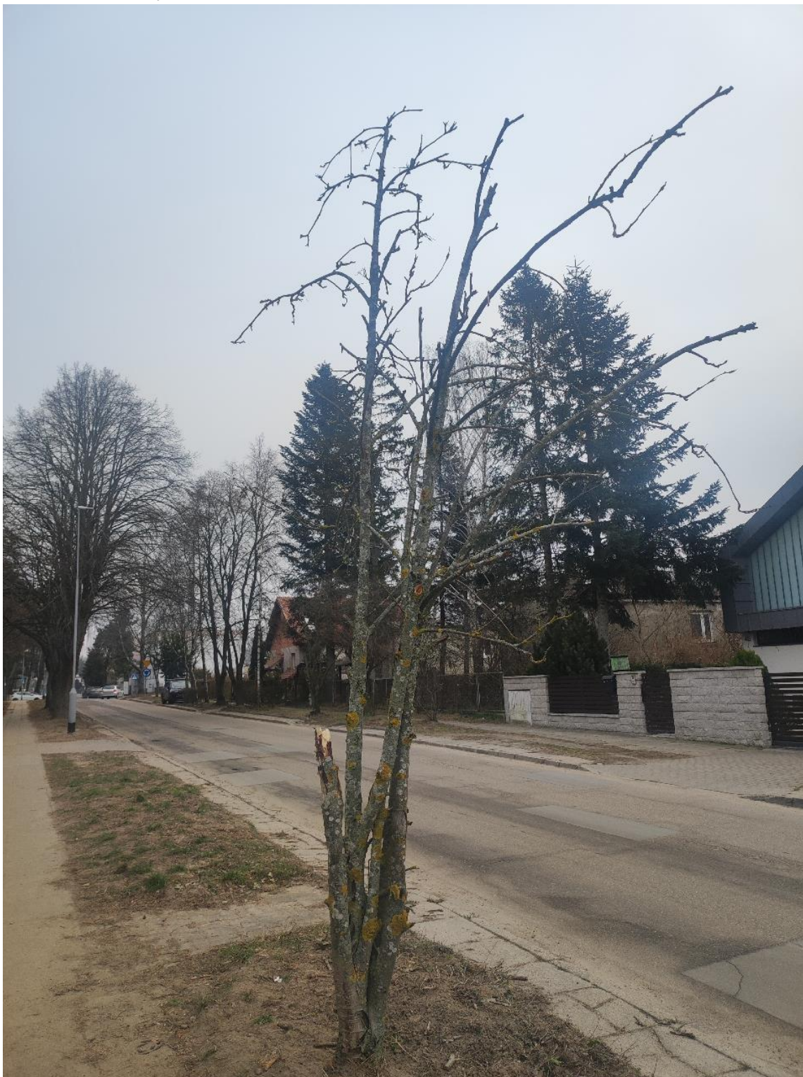
Dokumentacja fotograficzna drzewa nr 1