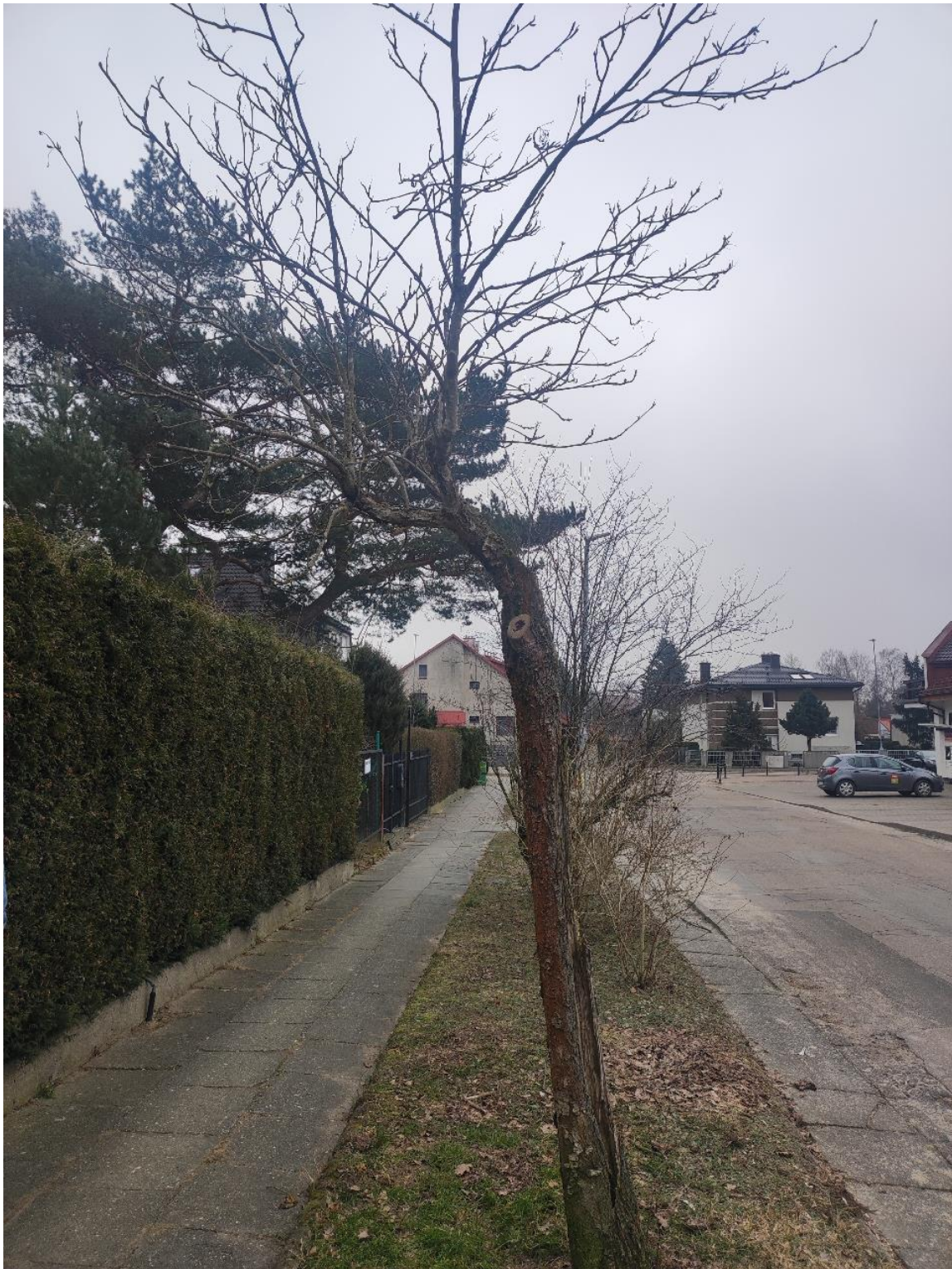
Dokumentacja fotograficzna drzewa nr 2