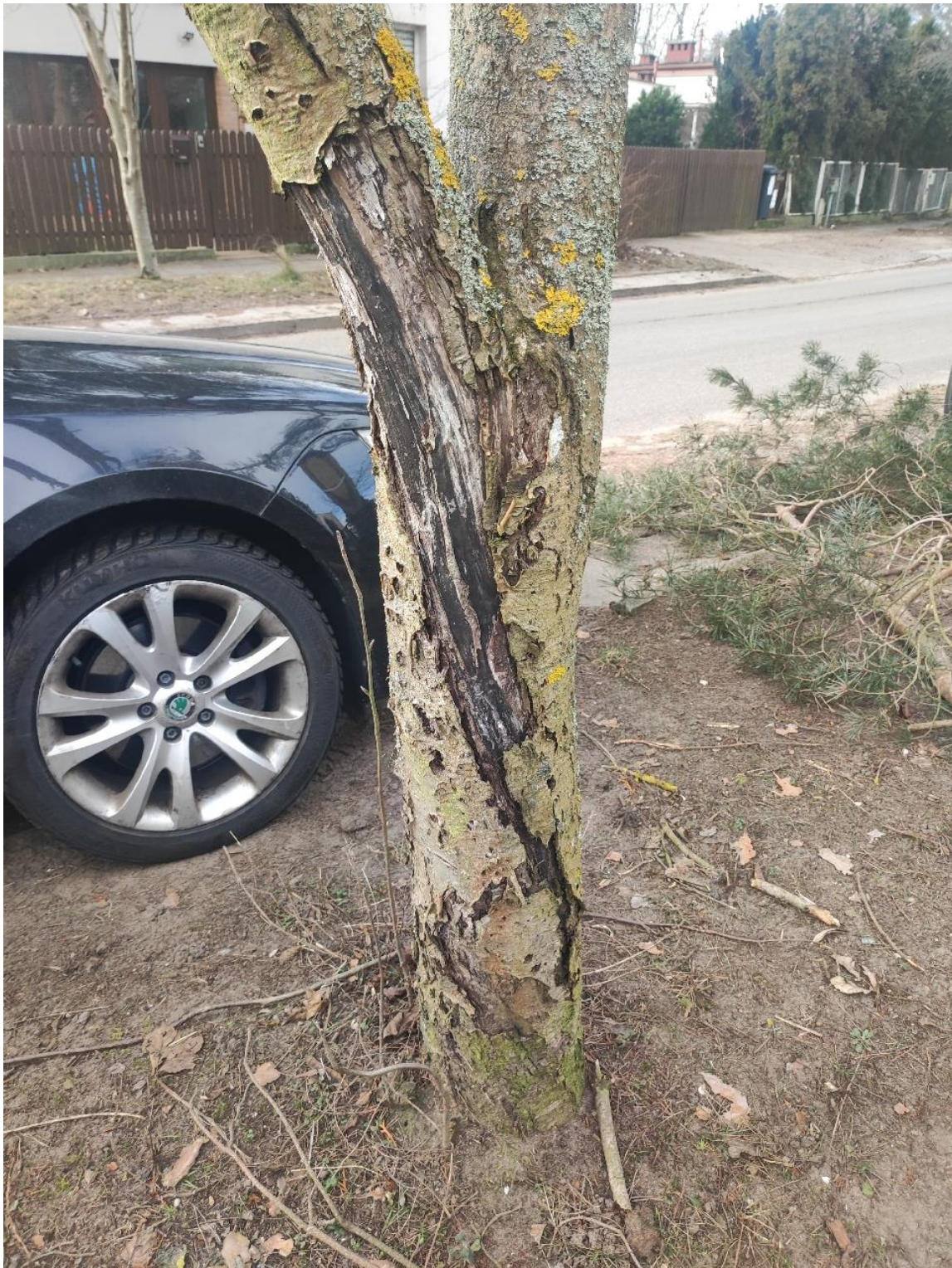
Dokumentacja fotograficzna drzewa nr 3