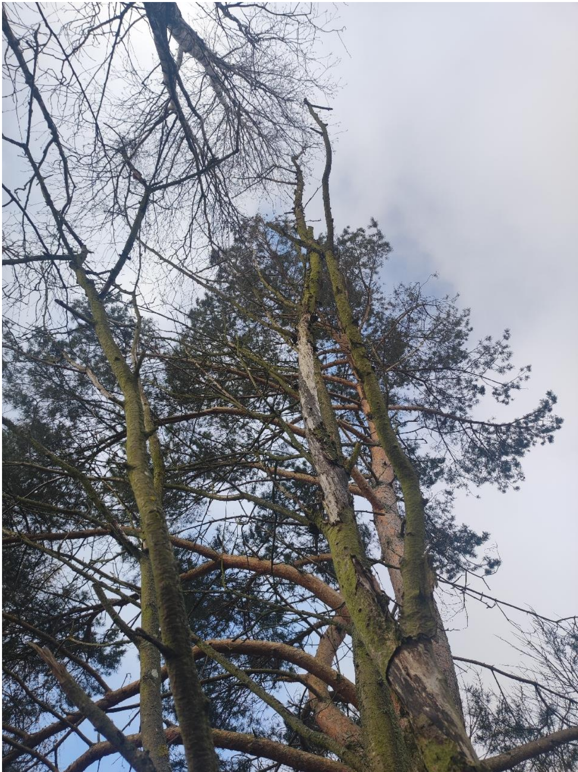
Dokumentacja fotograficzna drzewa nr 3