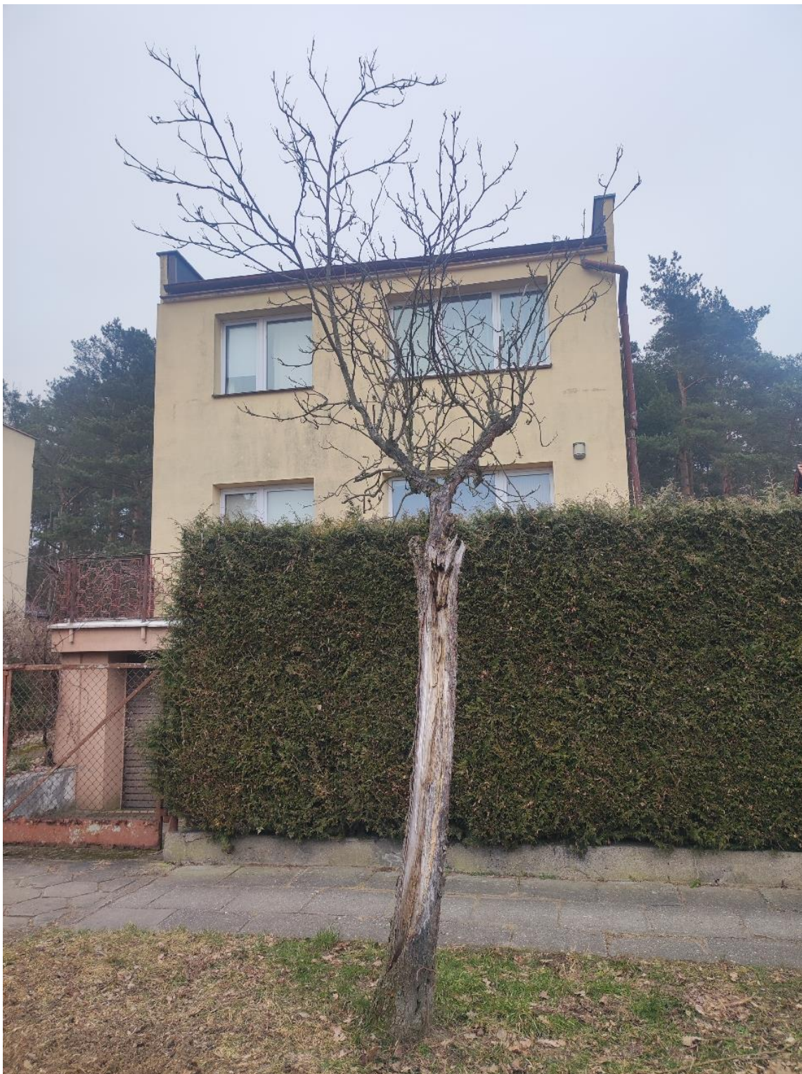
Dokumentacja fotograficzna drzewa nr 2