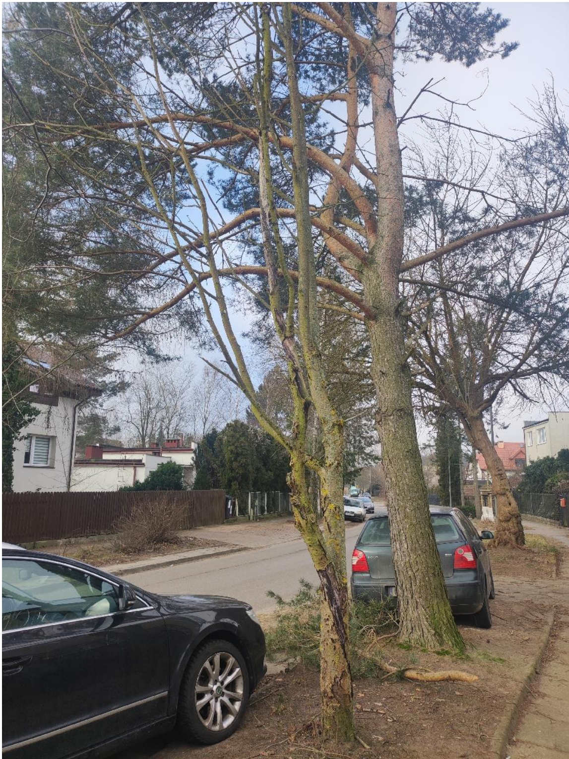
Dokumentacja fotograficzna drzewa nr 3