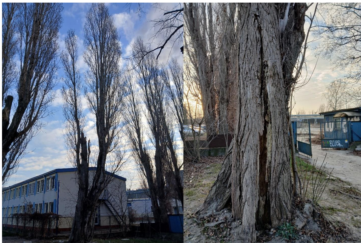
Dokumentacja fotograficzna drzewa