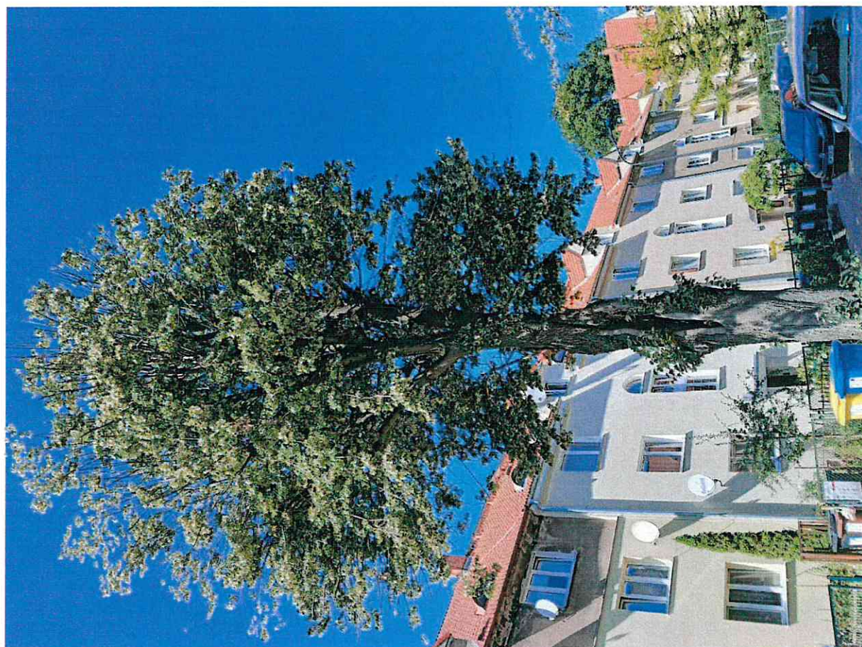
Dokumentacja fotograficzna drzewa