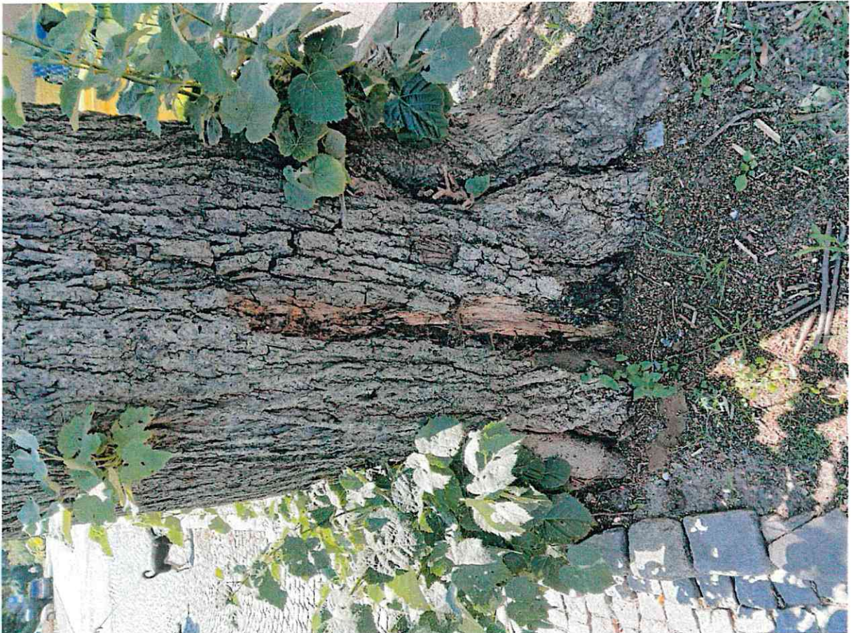
Dokumentacja fotograficzna- zgliszczak, ubytek