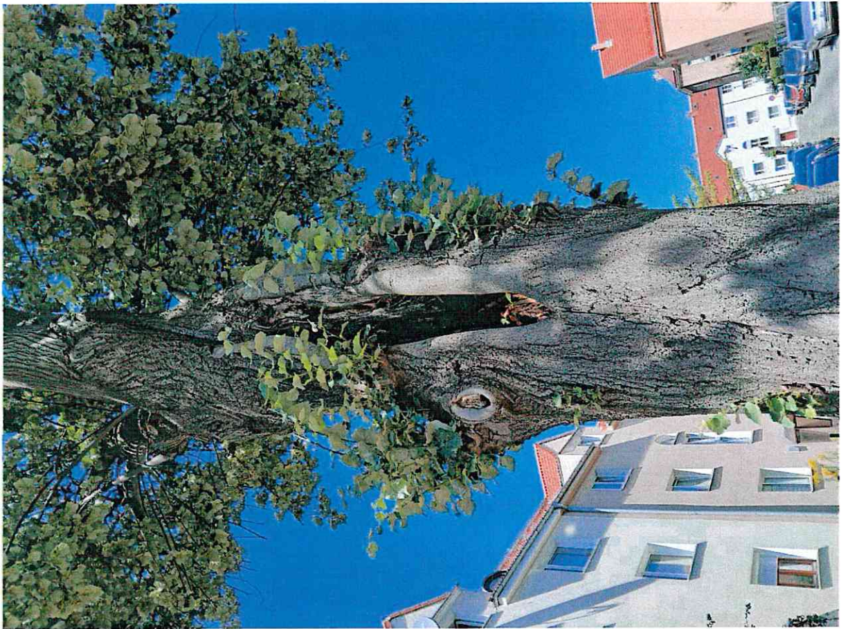
Dokumentacja fotograficzna- ubytek