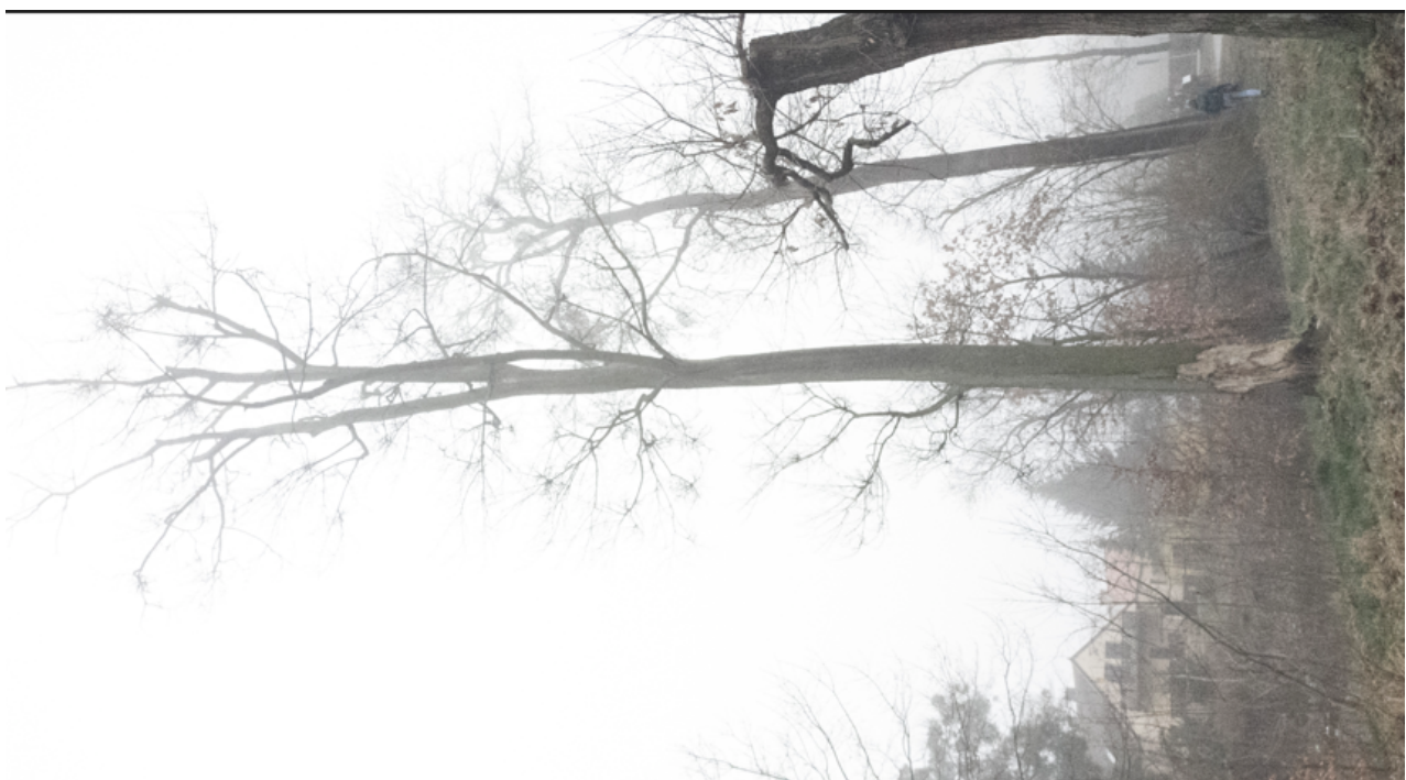
Dokumentacja fotograficzna drzewa