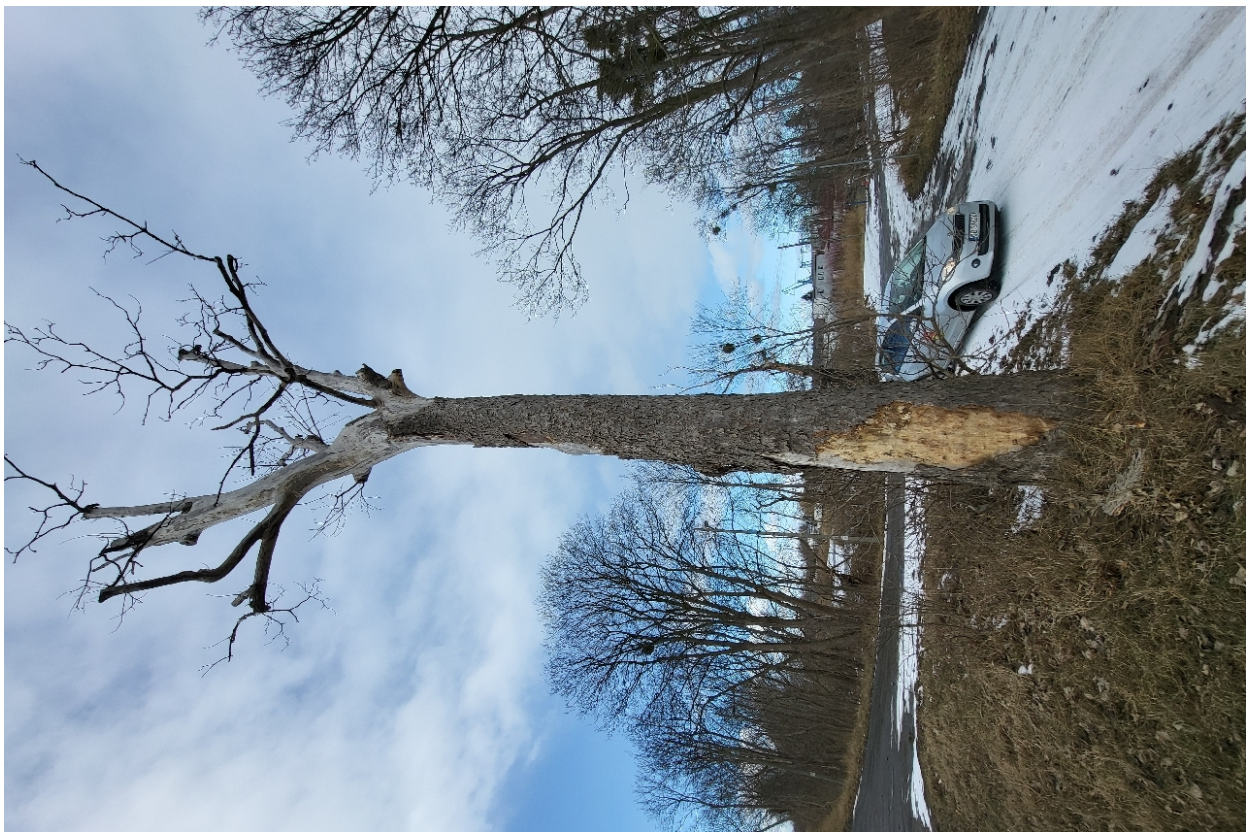
Dokumentacja fotograficzna drzewa nr 2