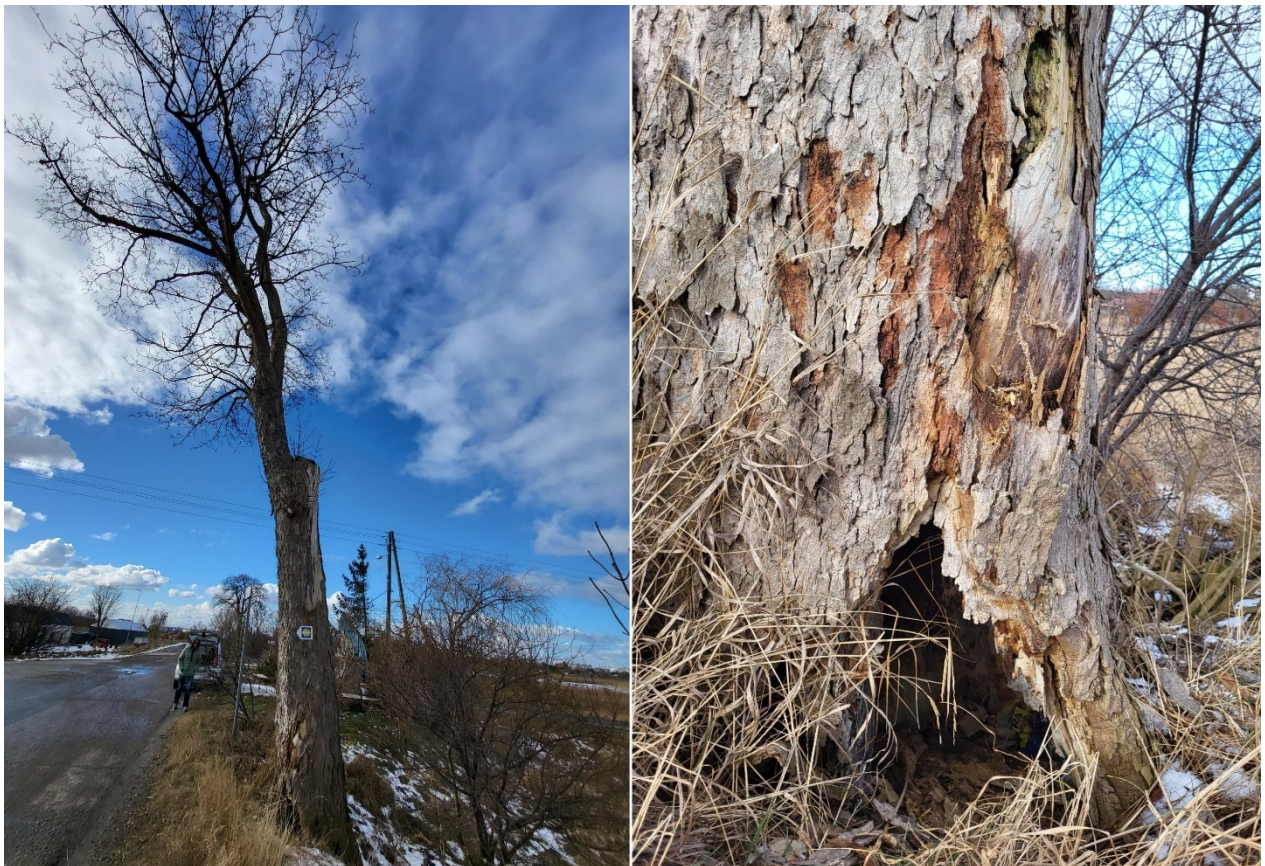
Dokumentacja fotograficzna drzewa nr 1