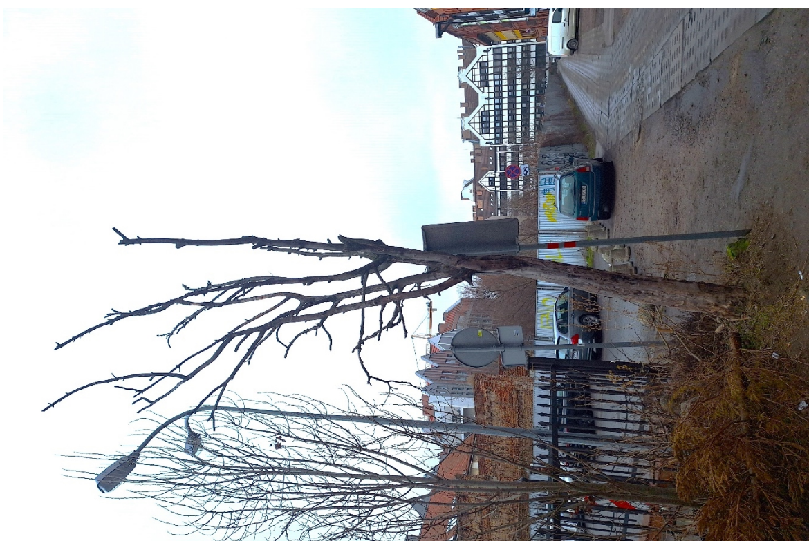
Dokumentacja fotograficzna drzewa