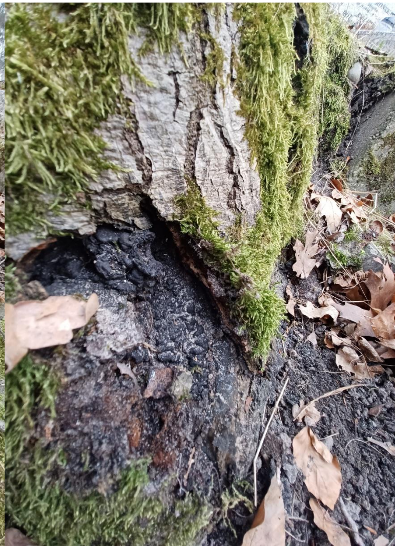
Fot. nr 6. Drzewo nr 3 – podstawa pnia