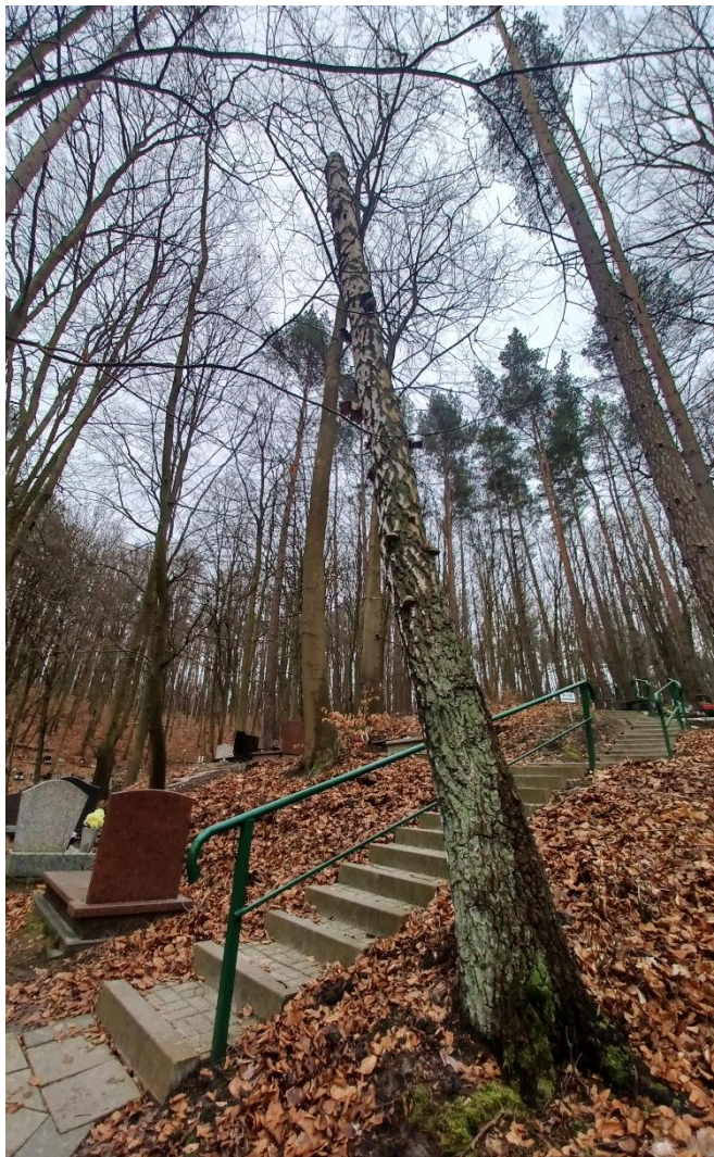
Fot. nr 3. Drzewo nr 2 – ogólna sylwetka drzewa