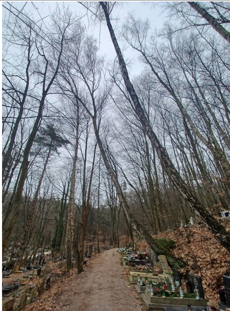
Fot. nr 1. Drzewo nr 1 – ogólna sylwetka drzewa