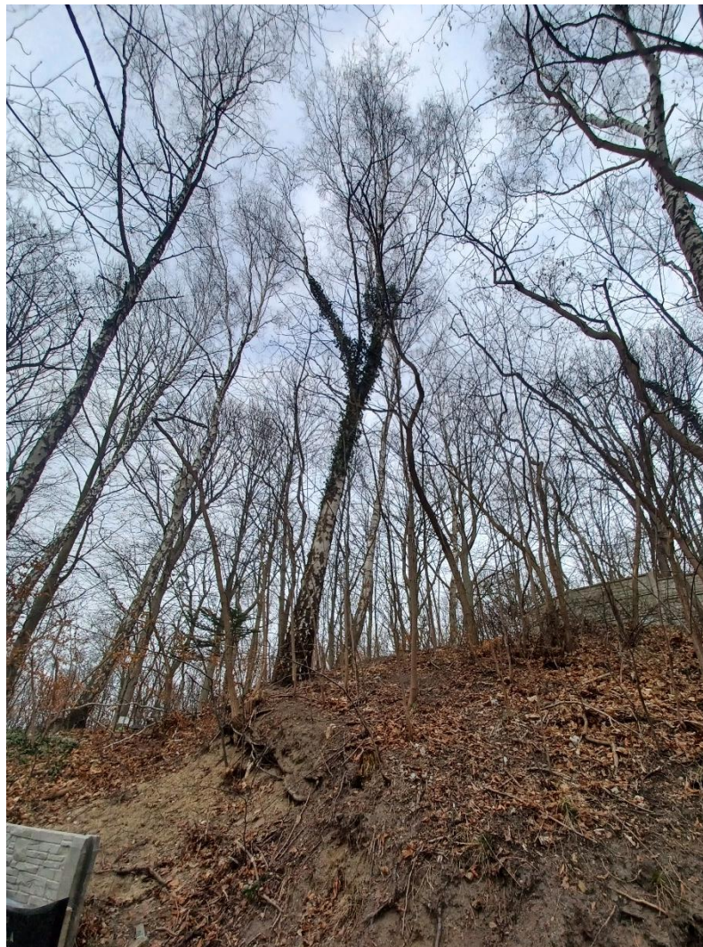
Fot. nr 9. Drzewo nr 4 - ogólna sylwetka drzewa