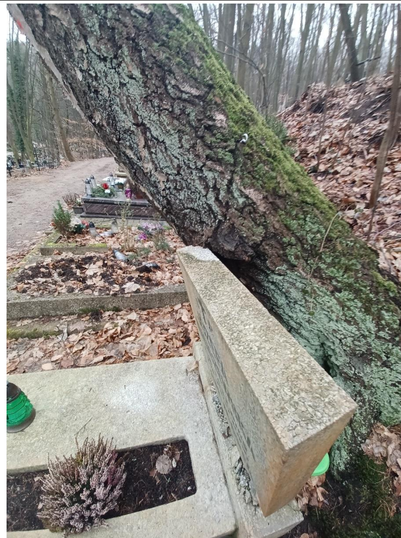
Fot. nr 2. Drzewo nr 1 – miejsce kolizji