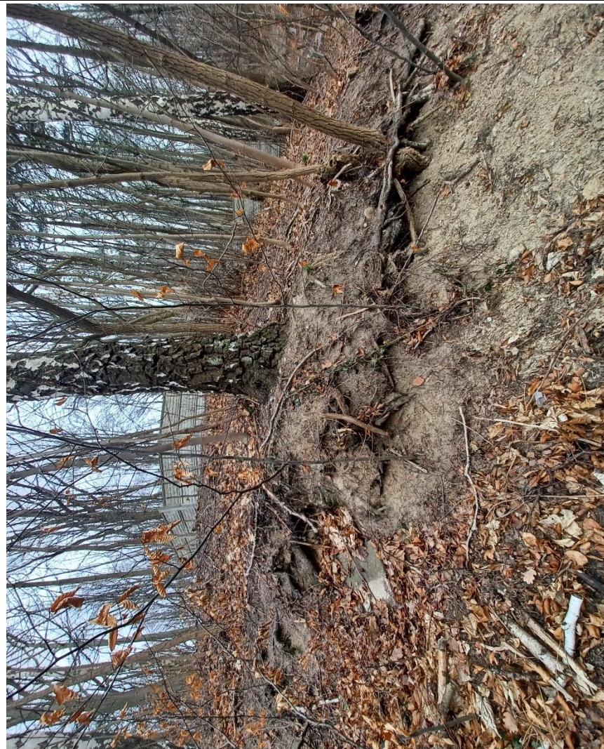
Fot. nr 10. Drzewo nr 4 - zbliżenie na podstawę pnia od strony podstawy skarpy