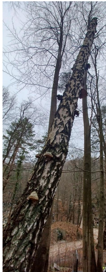
Fot. nr 4. Drzewo nr 2 – owocniki hubiaka pospolitego