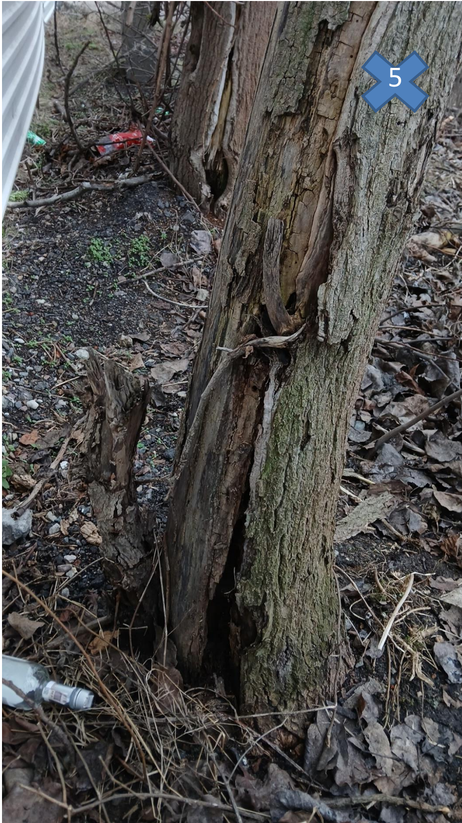
zgodnie z tab. z pkt. nr 3, drzewo nr 5 (ubytek pnia, martwica)