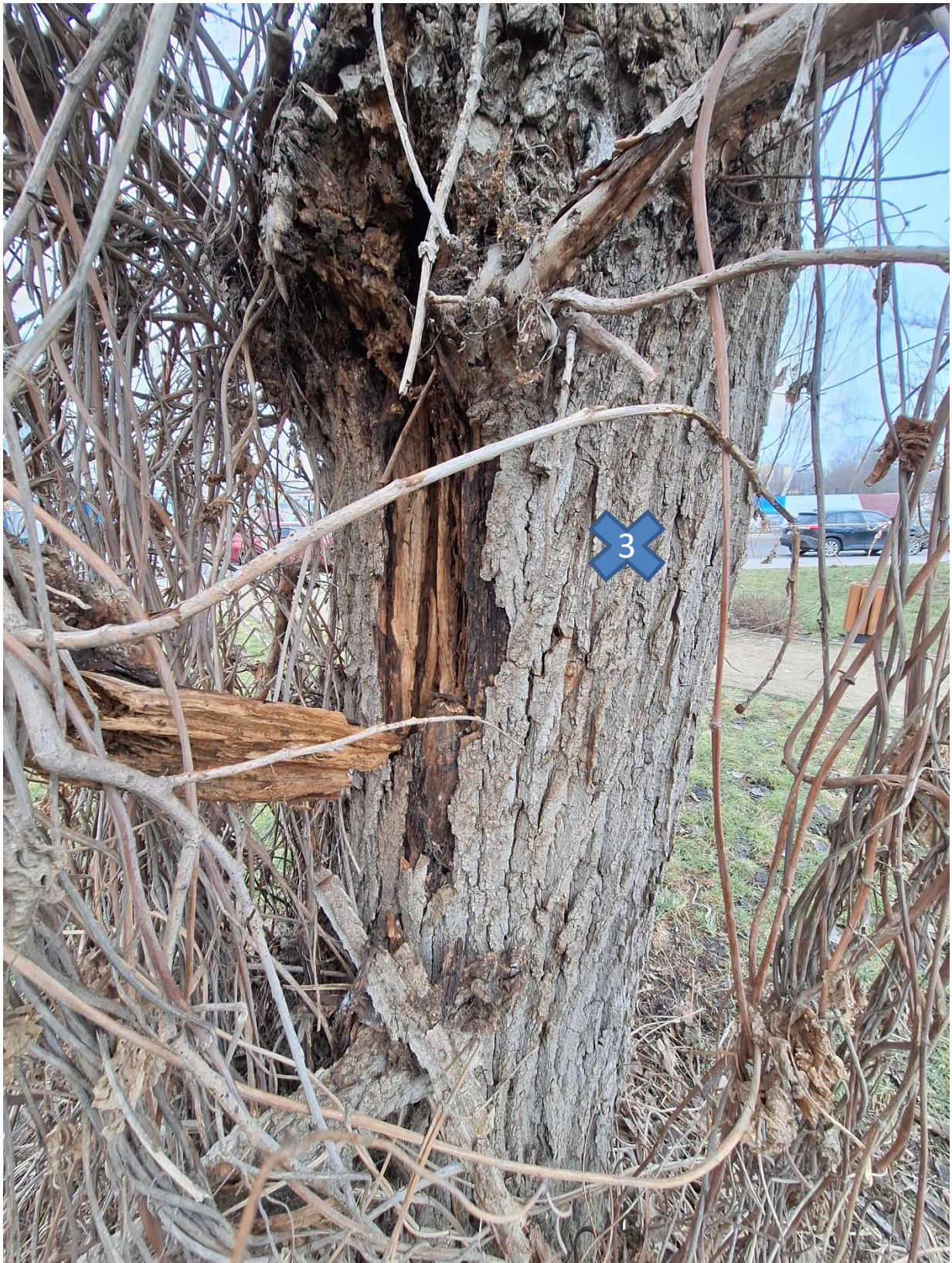
zgodnie z tab. z pkt. nr 3, drzewo nr 3 (martwica na pniu)