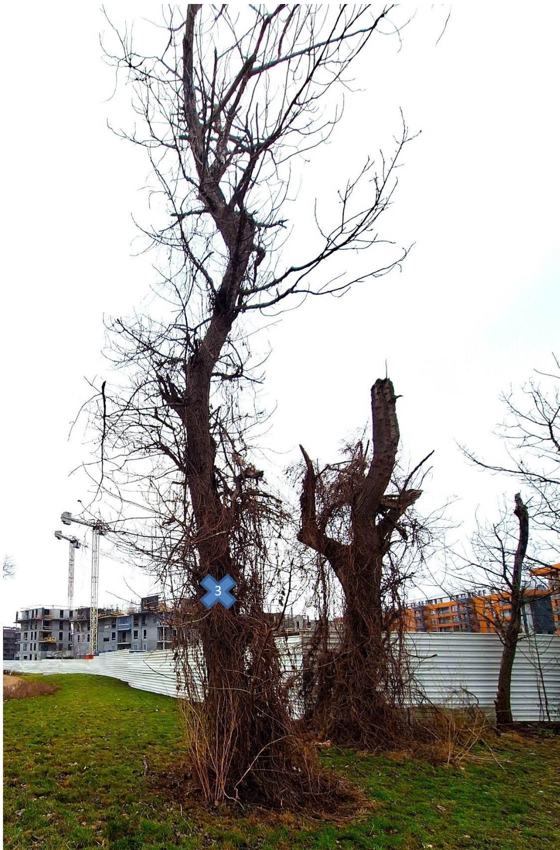
zgodnie z tab. z pkt. nr 3, drzewo nr 3