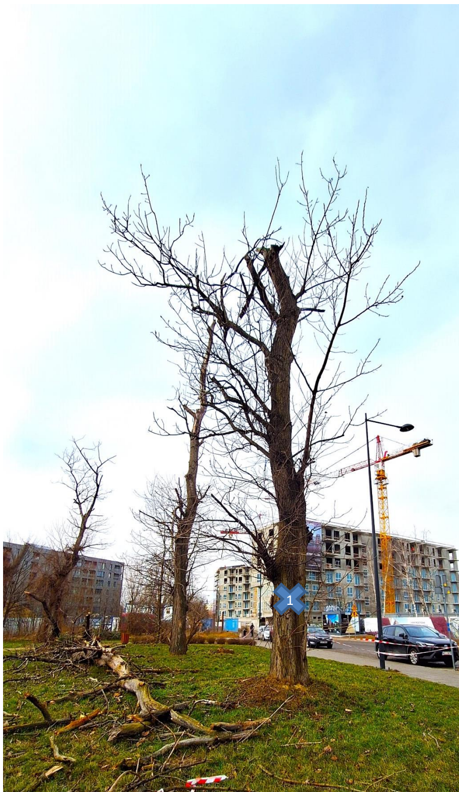
zgodnie z tab. z pkt. nr 3, drzewo nr 1

Załącznik 2 – Dokumentacja fotograficzna do pisma znak PD.5314.103.2025.MH z dnia 20.03.2025 r.