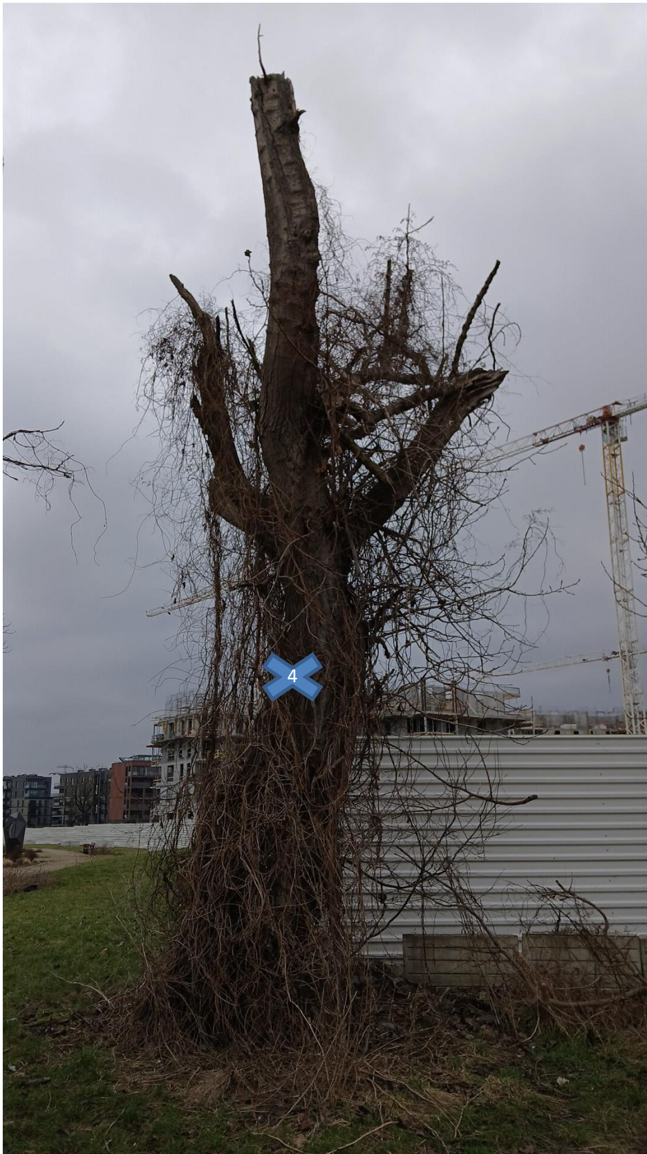
zgodnie z tab. z pkt. nr 3, drzewo nr 4