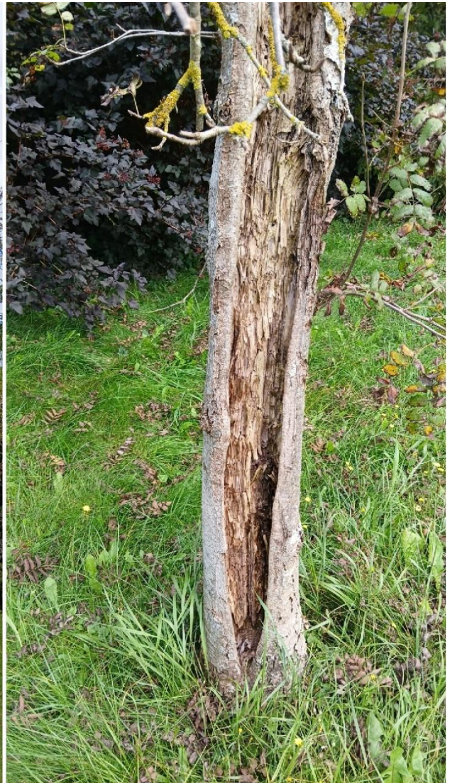
Dokumentacja fotograficzna drzewa nr 2