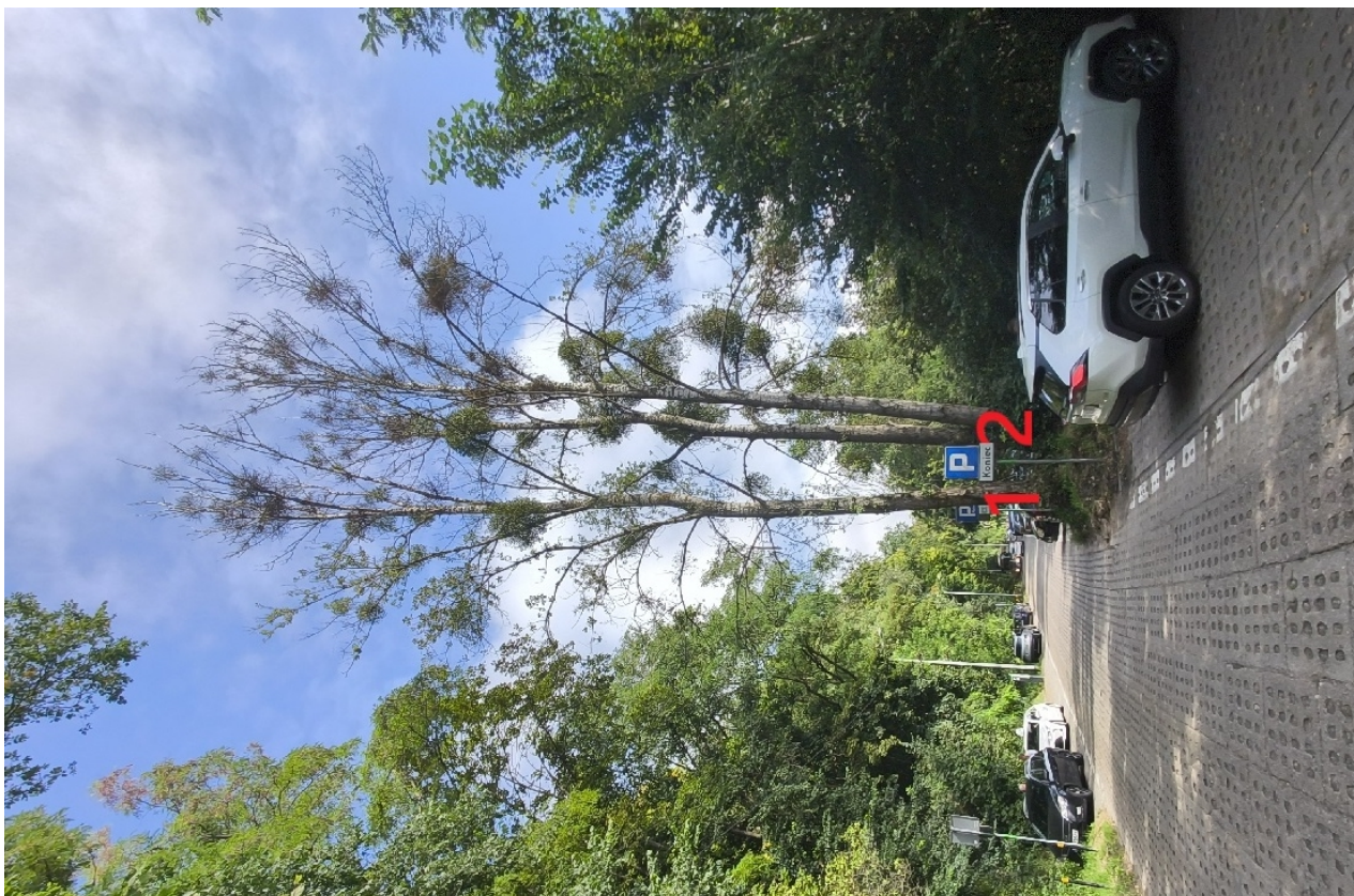
Dokumentacja fotograficzna drzewa nr 1 i 2