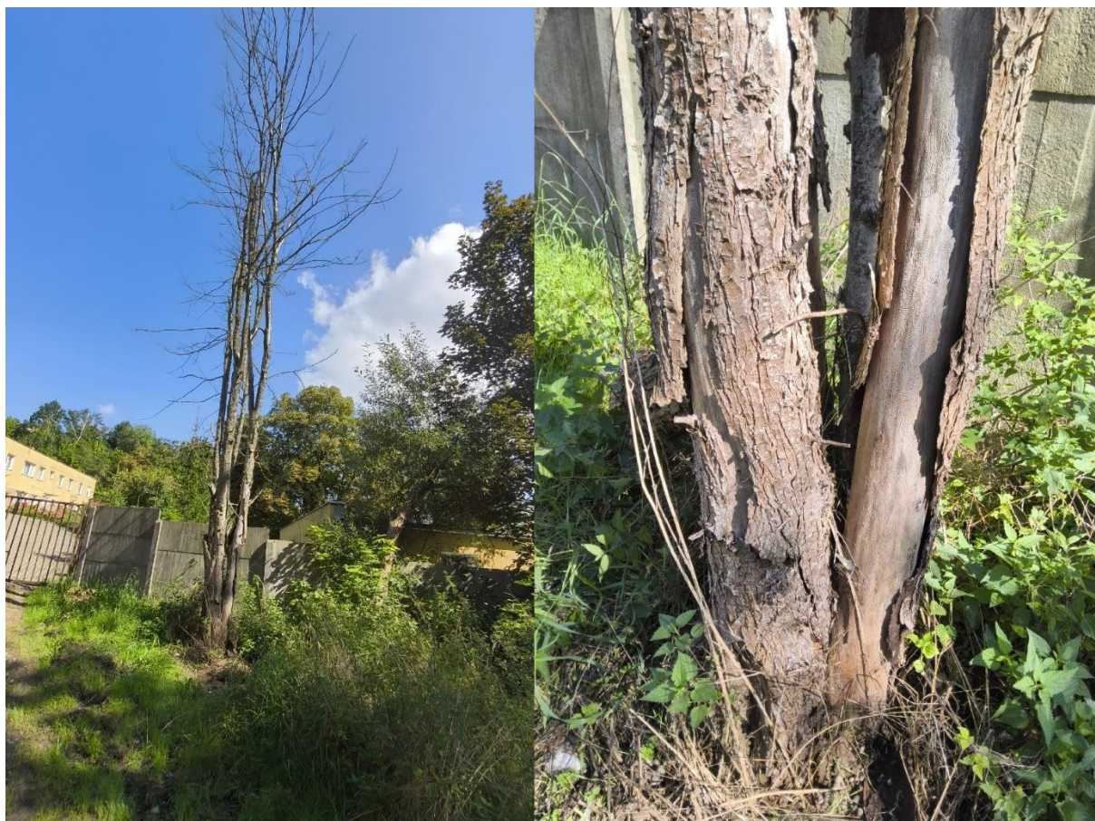
Dokumentacja fotograficzna drzewa nr 1; detal