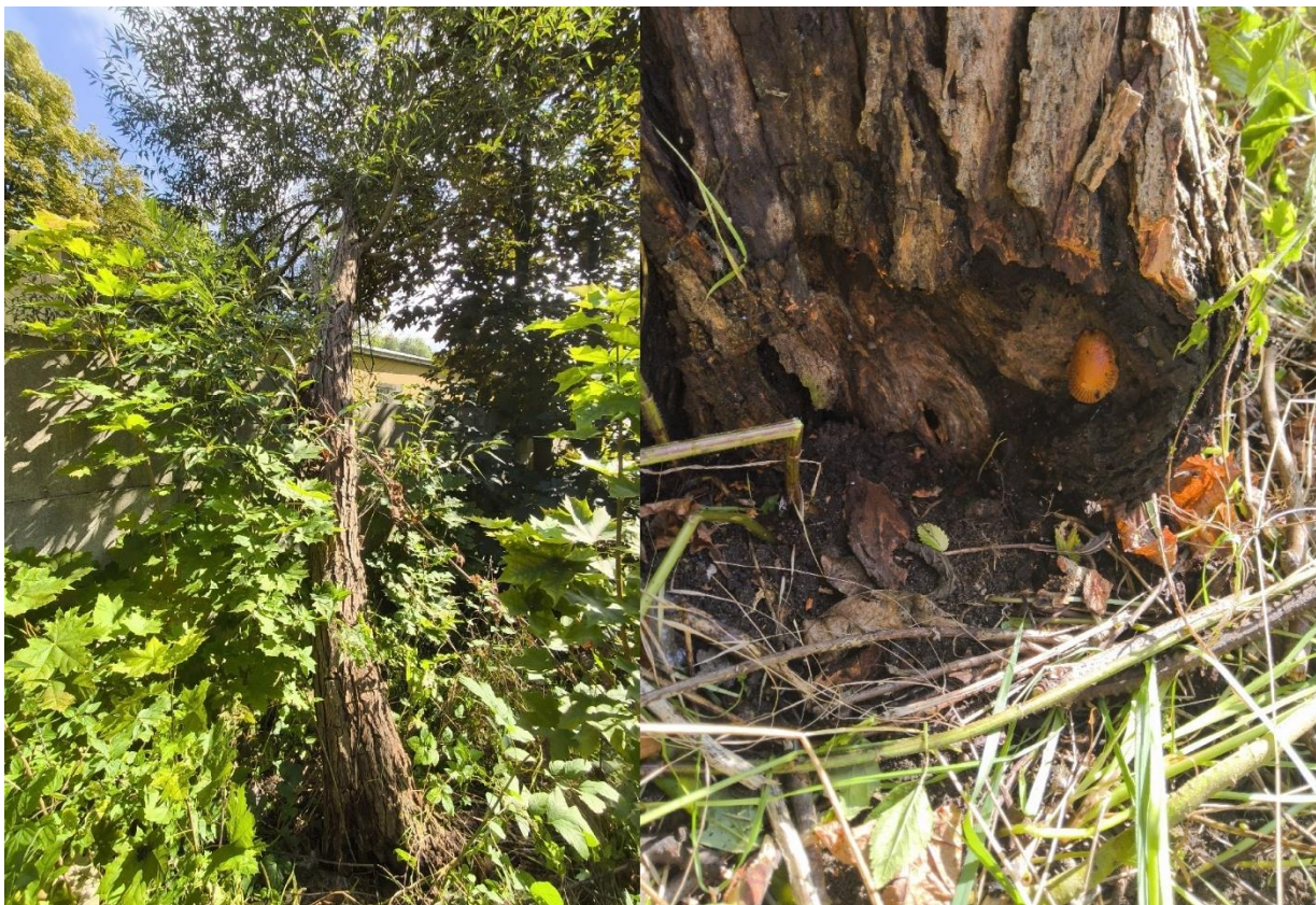
Dokumentacja fotograficzna drzewa nr 2; detal