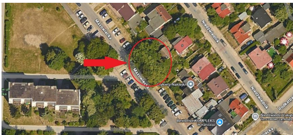
Lokalizacja wnioskowanych drzew do usunięcia.