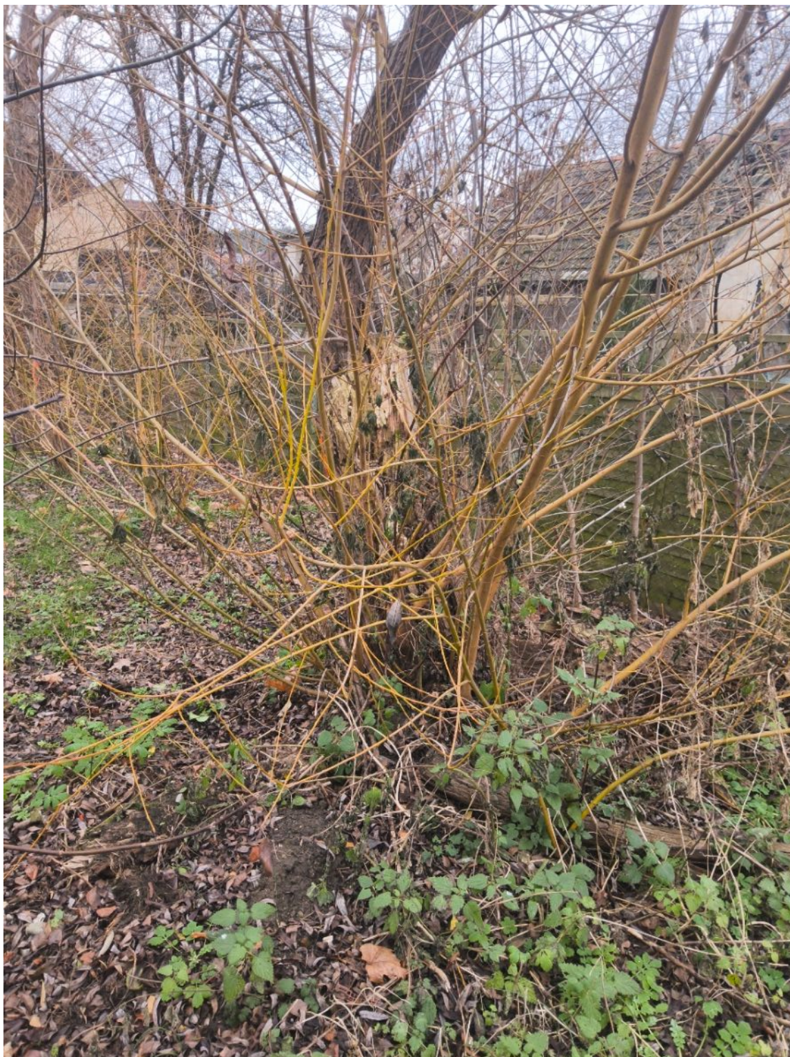
Fotografia nr 2 - drzewo nr 2.