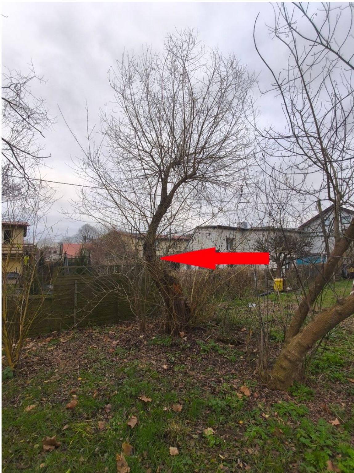
Fotografia nr 2 - sylwetka wnioskowanego drzewa nr 2.