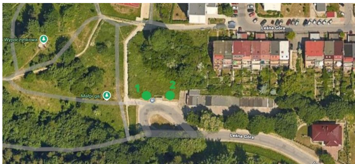
Lokalizacja drzew do nasadzenia.