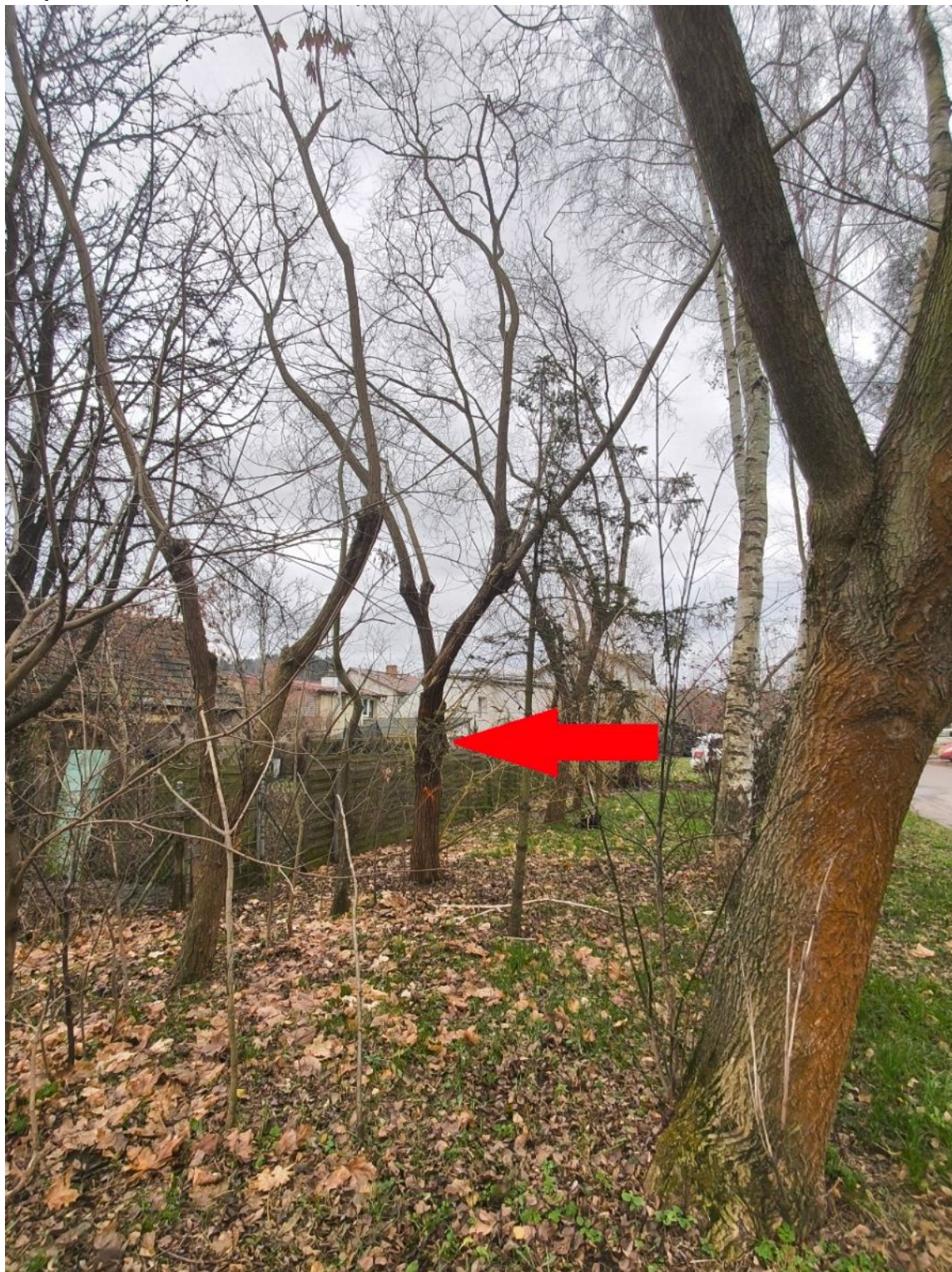
Fotografia nr 1 - sylwetka wnioskowanego drzewa nr 1.