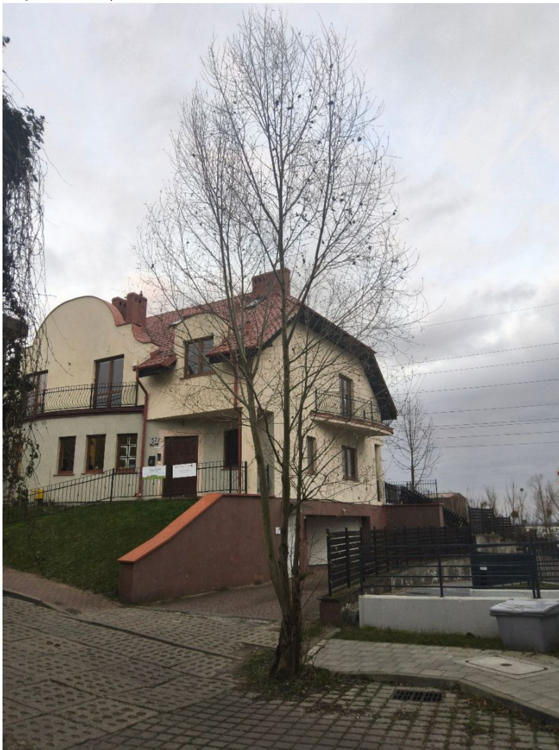
Fotografia nr 1 - sylwetka wnioskowanego drzewa.