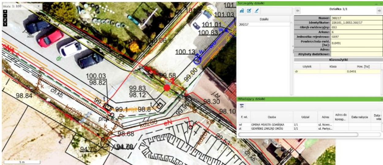
Mapa - lokalizacja drzewa do usunięcia, ul. Widok 57.