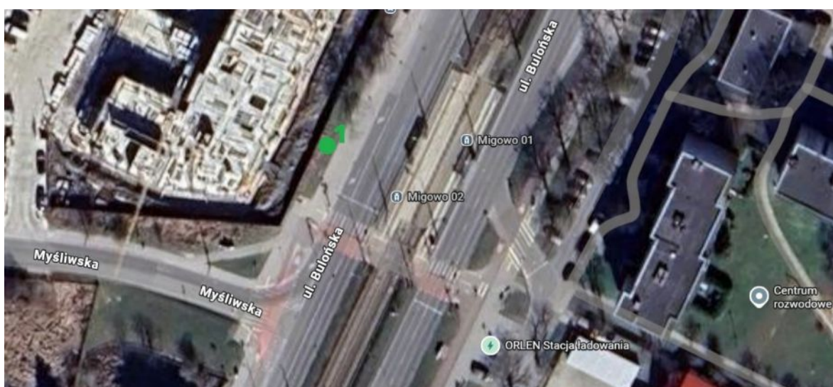
Lokalizacja drzewa do nasadzenia.