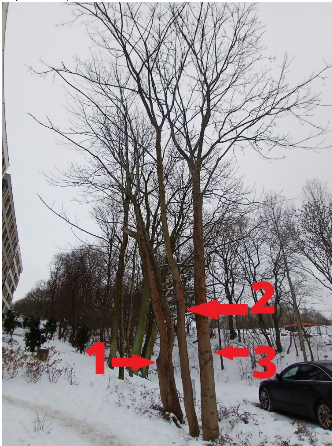
Fotografia nr 1 - wnioskowane drzewa od nr 1 do nr 3.