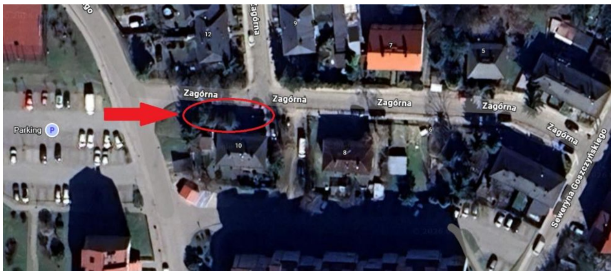
Lokalizacja wnioskowanych drzew do usunięcia.