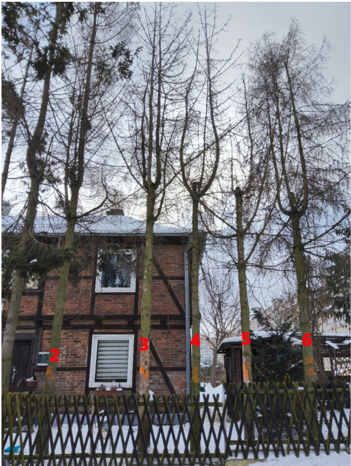
Fotografia nr 2 - wnioskowane drzewa od nr 2 do nr 6.