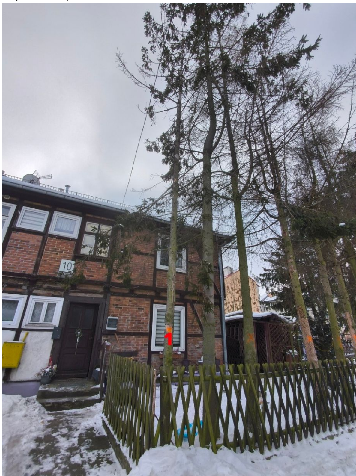
Fotografia nr 1 - wnioskowane drzewo nr 1.