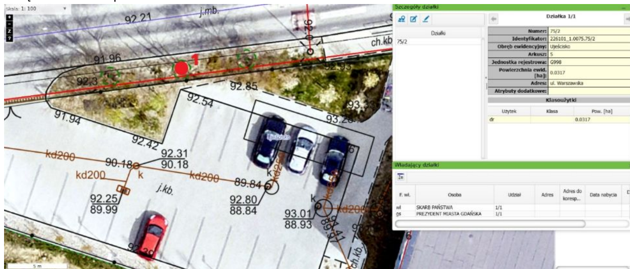
Mapa - lokalizacja drzewa do usunięcia, ul. Warszawska.

Załącznik nr 1 do pisma nr PD.5103.166.2026.KB