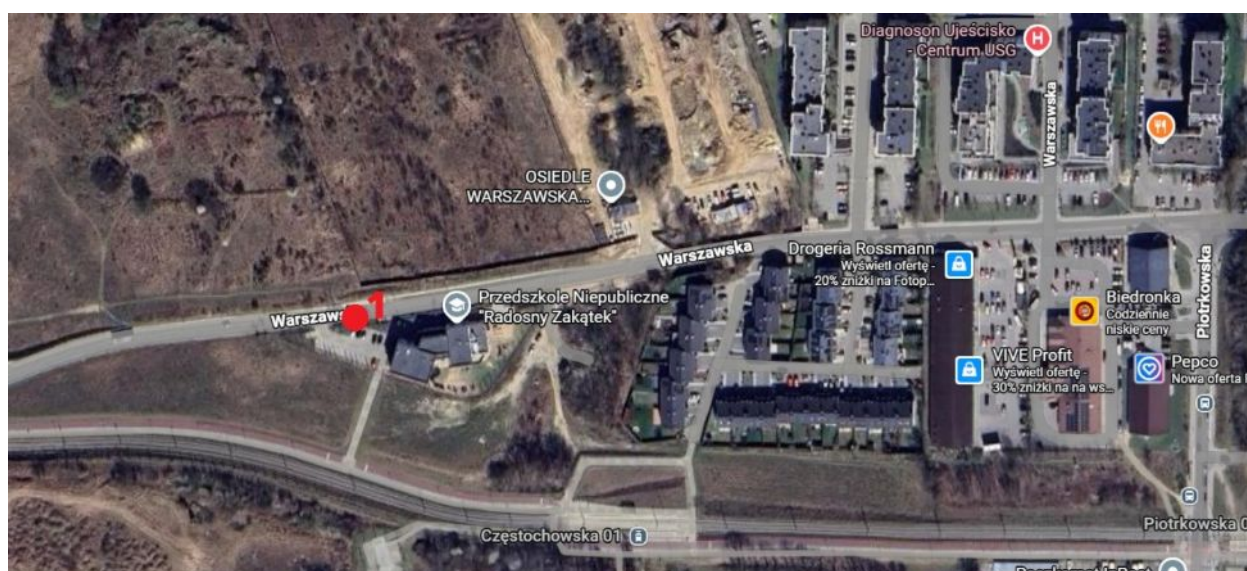
Lokalizacja wnioskowanego drzewa do usunięcia.