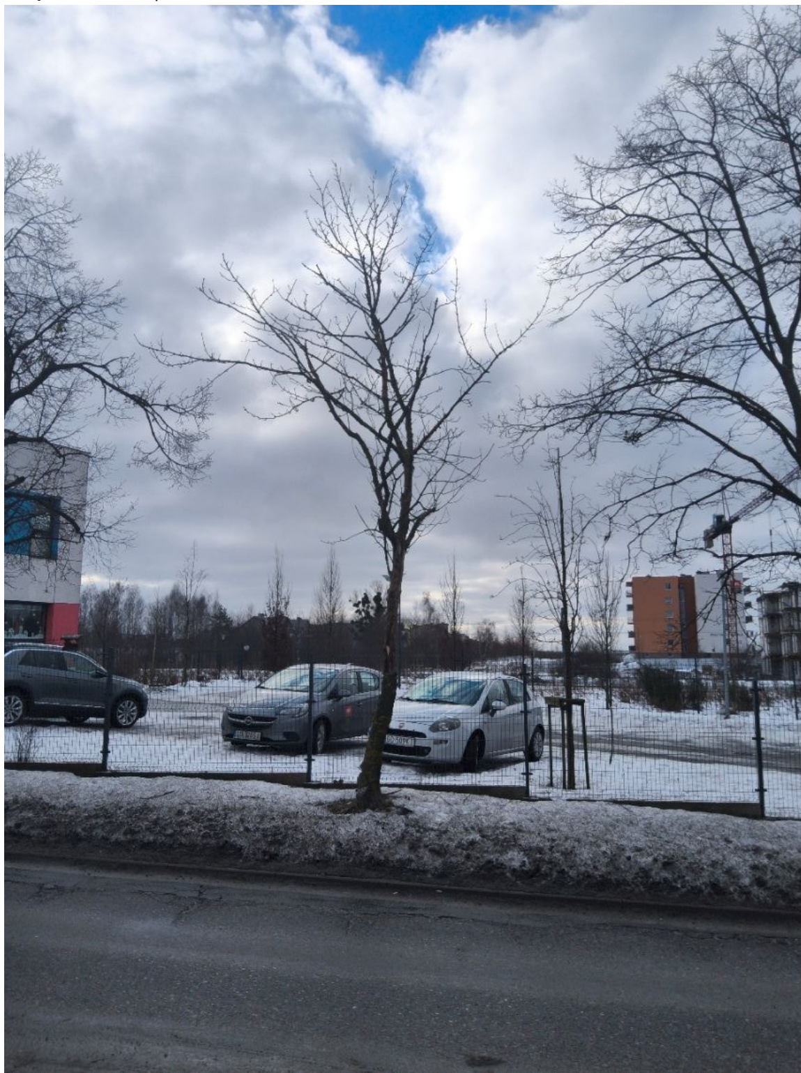
Fotografia nr 1 - sylwetka wnioskowanego drzewa.