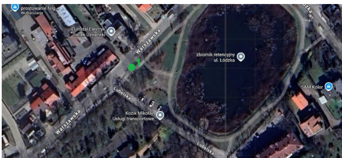
Lokalizacja drzewa do nasadzenia.