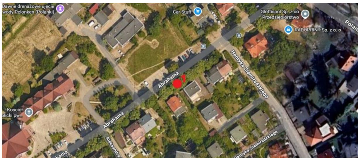
Lokalizacja drzewa do usunięcia.