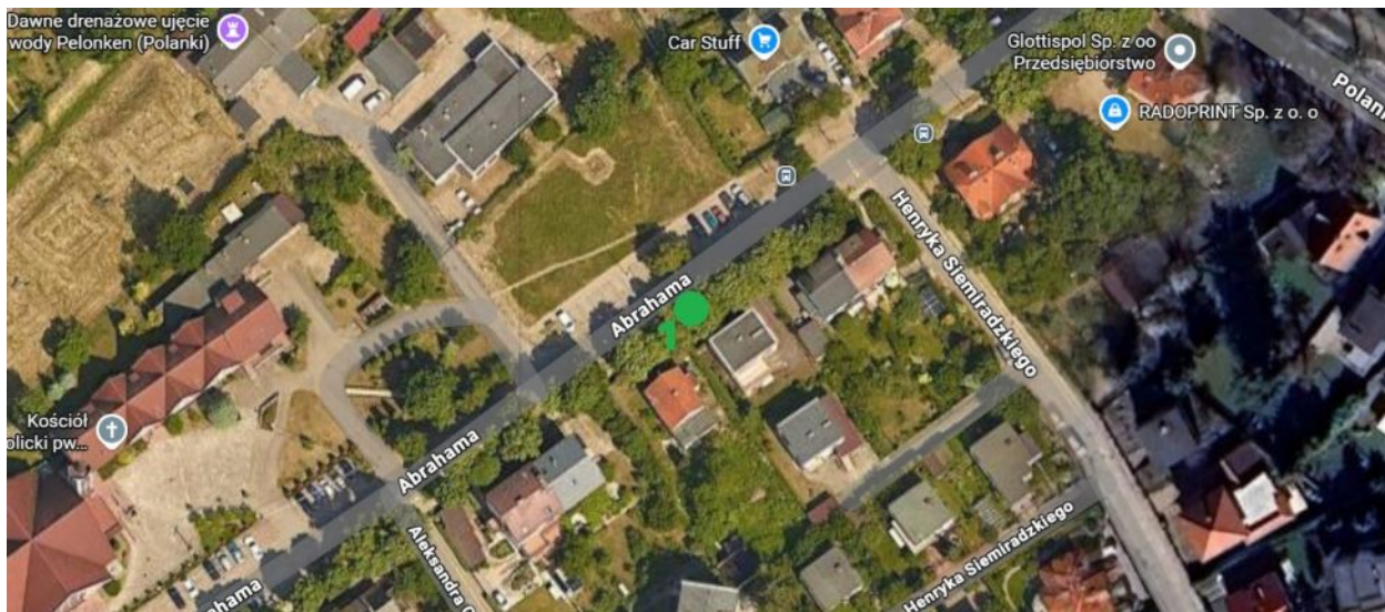
Lokalizacja drzewa do nasadzenia.