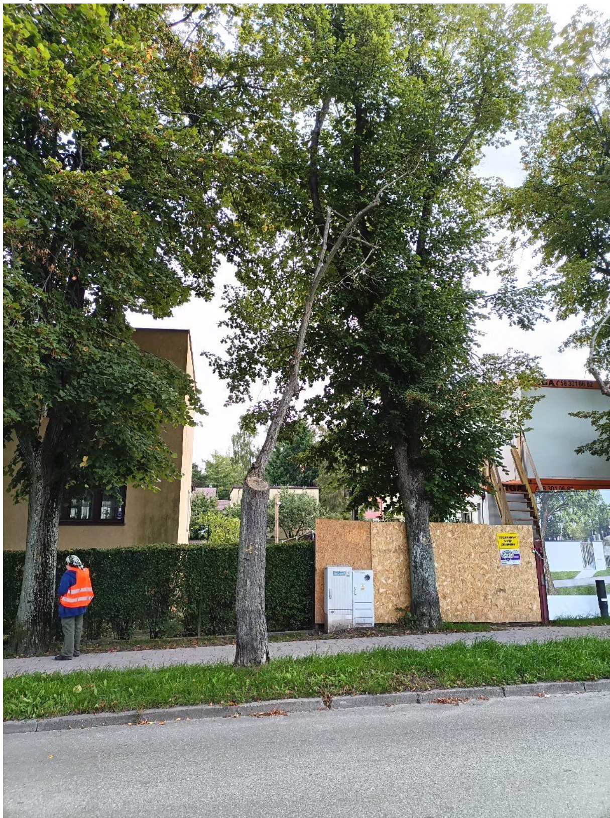
Fotografia nr 1 - sylwetka wnioskowanego drzewa.