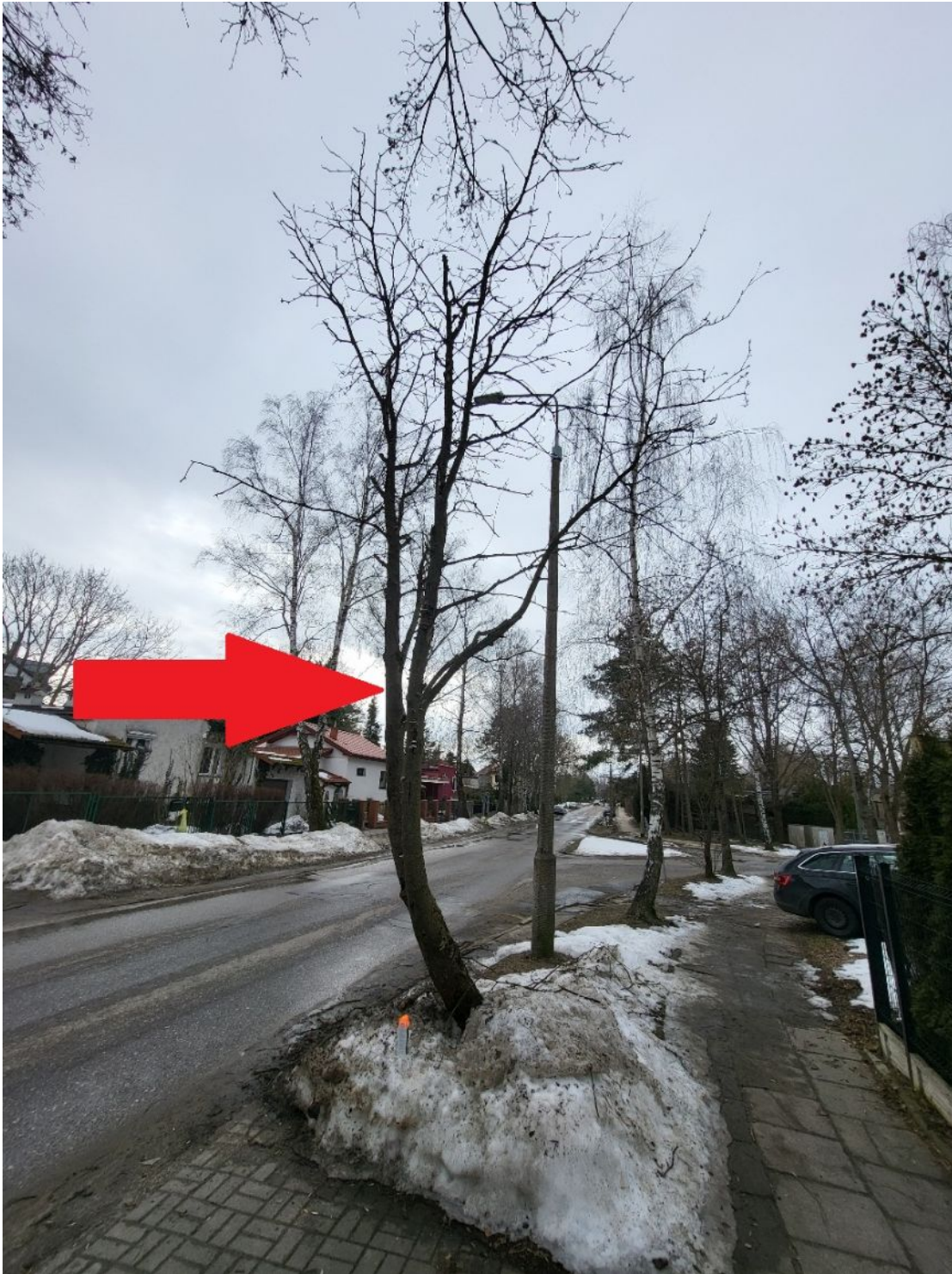
Fotografia nr 1 - sylwetka wnioskowanego drzewa.