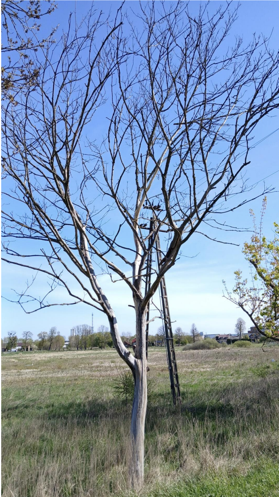
zgodnie z tab. z pkt nr 4, drzewo nr 4