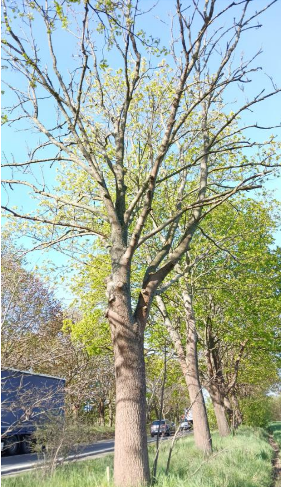
zgodnie z tab. z pkt nr 4, drzewo nr 1