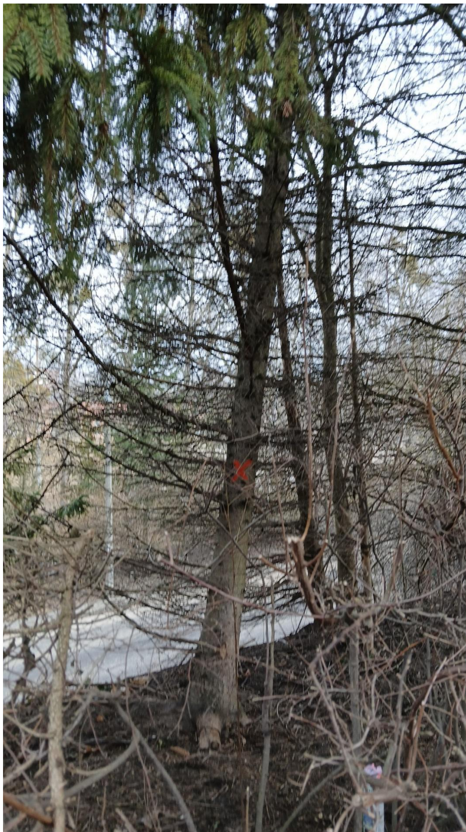
Drzewo nr 1 według numeracji z tabeli pkt nr 3

Załącznik 2 – Dokumentacja fotograficzna do pisma znak PD.5314.62.2025.MH z dnia 11.02.2025 r.