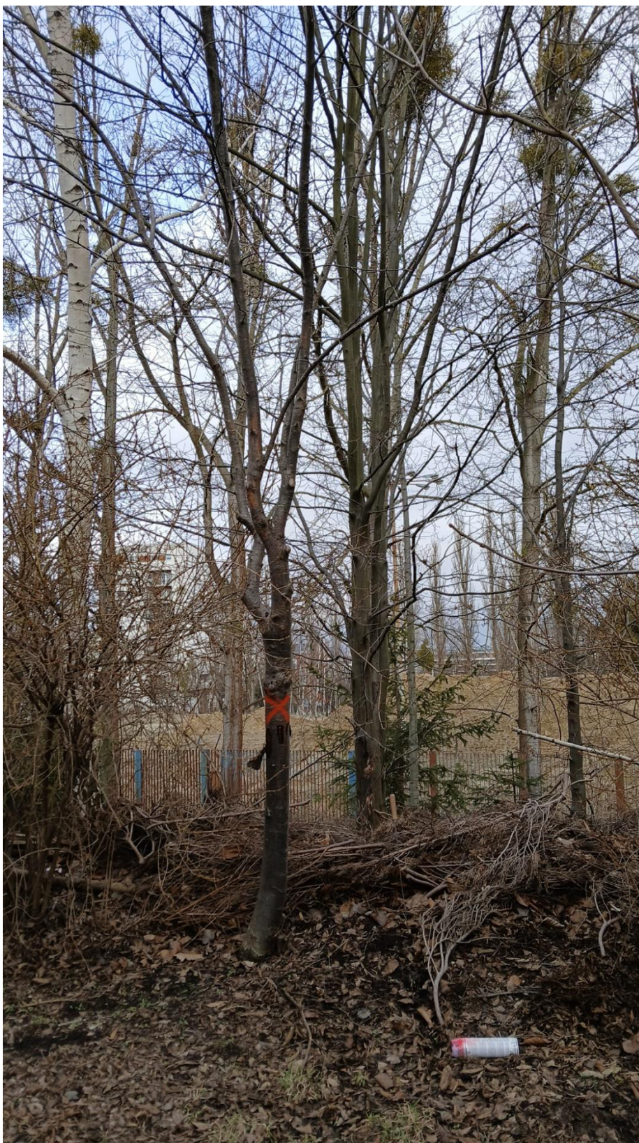
Drzewo nr 2 według numeracji z tabeli pkt nr 3