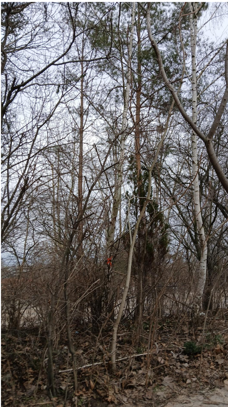
Drzewo nr 3 według numeracji z tabeli pkt nr 3