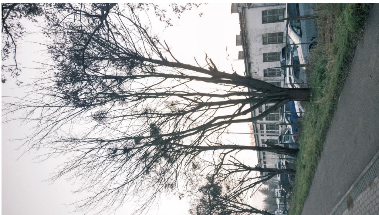
Dokumentacja fotograficzna drzewa