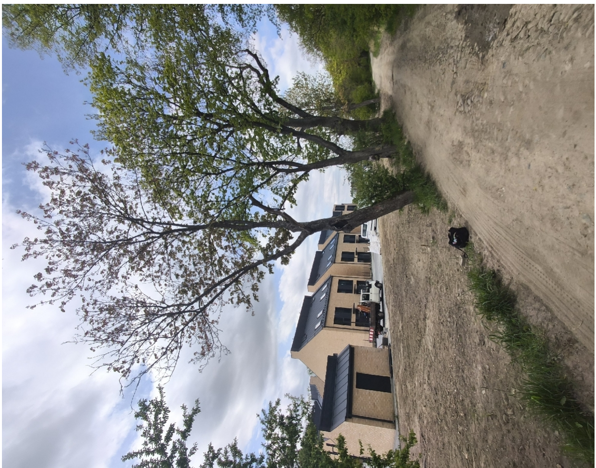
Dokumentacja fotograficzna drzewa nr 1