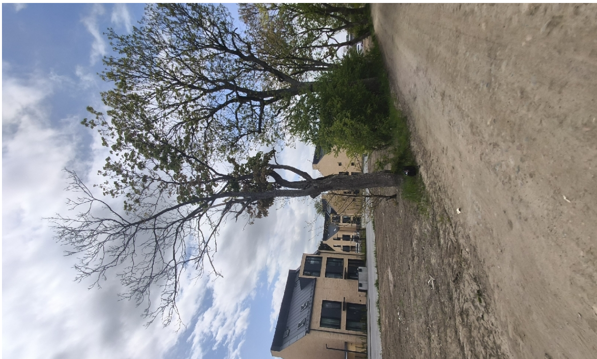
Dokumentacja fotograficzna drzewa nr 2