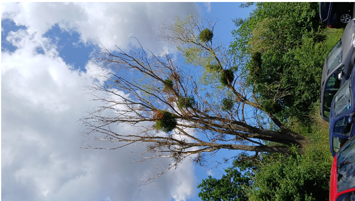
Dokumentacja fotograficzna drzewa