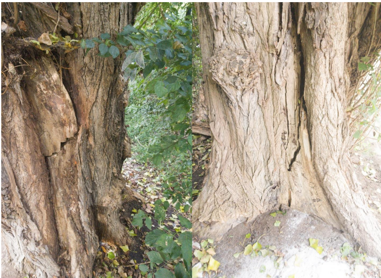
Dokumentacja fotograficzna; detal drzewa