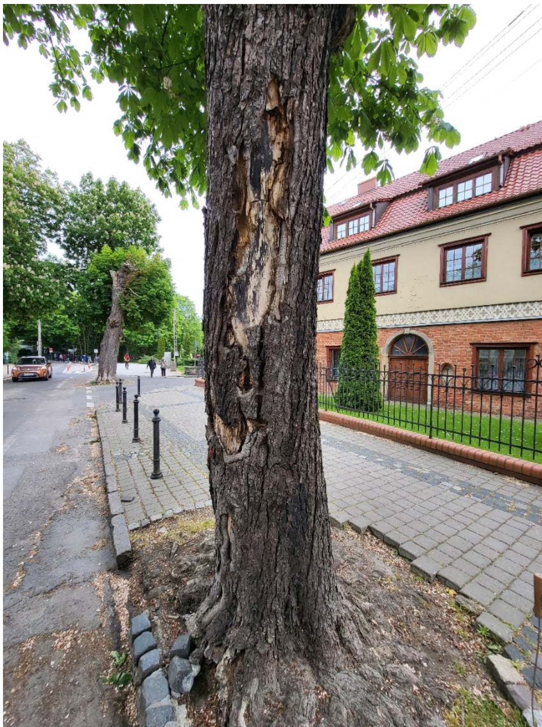
Fotografia nr 2.