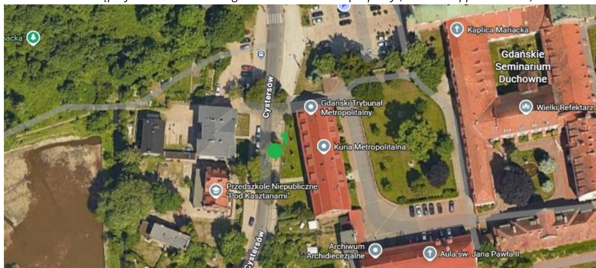
Lokalizacja drzewa do nasadzenia.