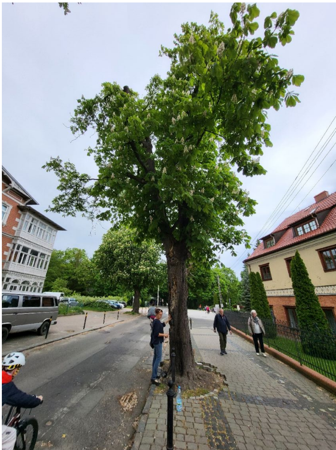
Fotografia nr 1 – sylwetka wnioskowanego drzewa.