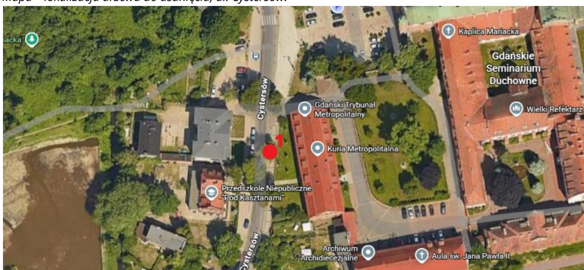
Lokalizacja drzewa do usunięcia.