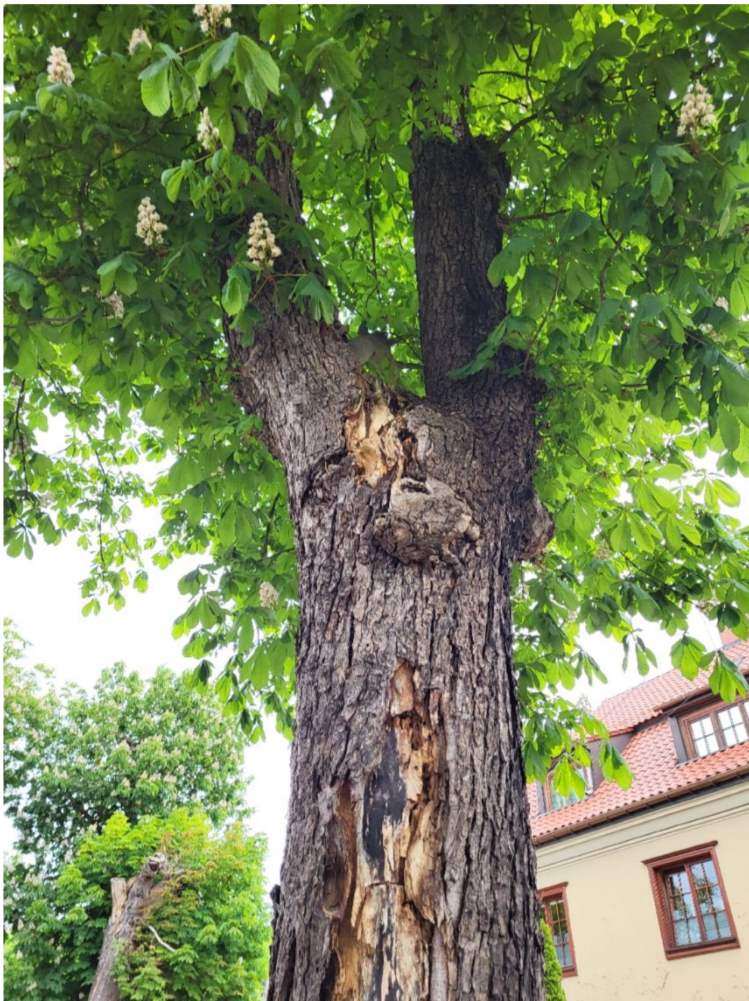
Fotografia nr 3.