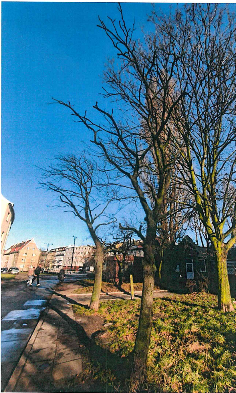
Dokumentacja fotograficzna drzewa nr 1