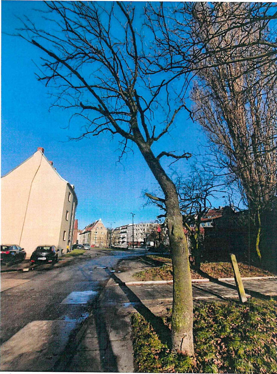
Dokumentacja fotograficzna drzewa nr 2