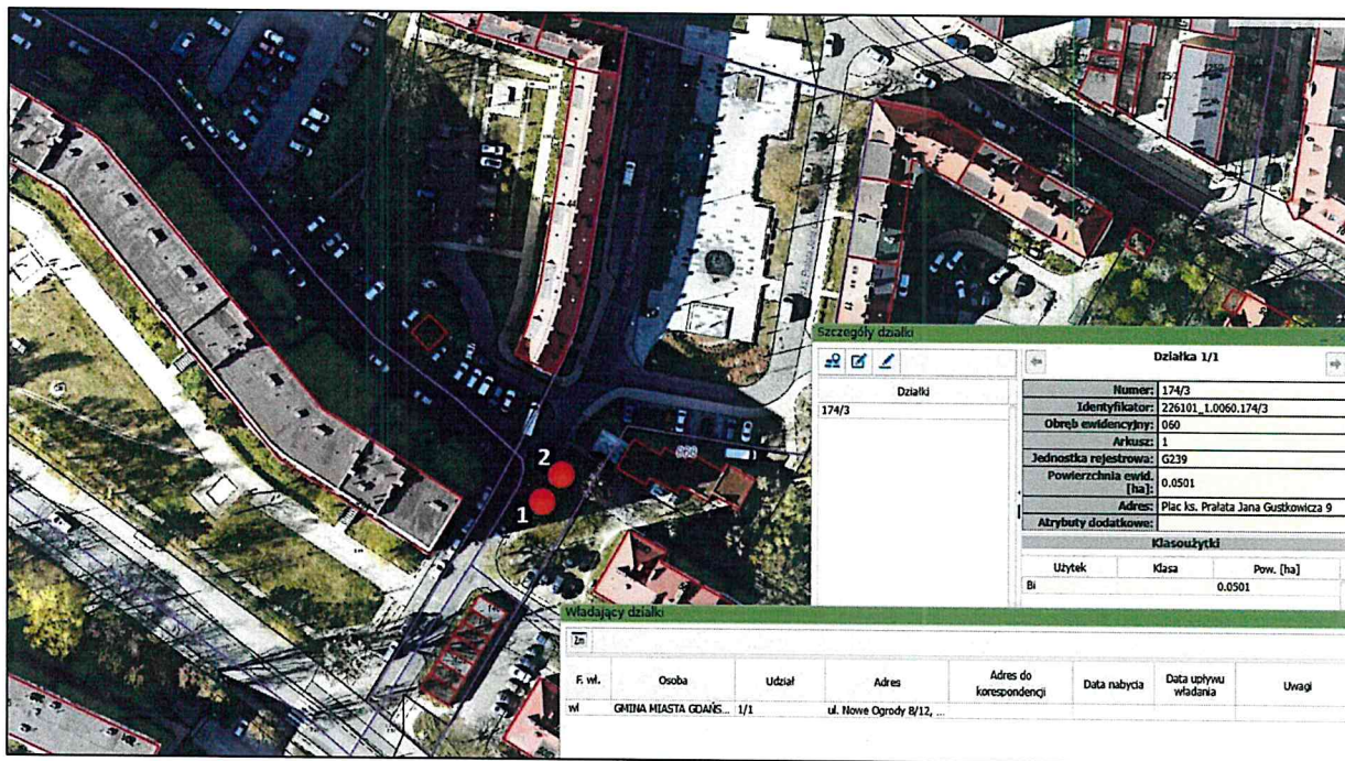
Mapa 1- lokalizacja drzew do wycinki