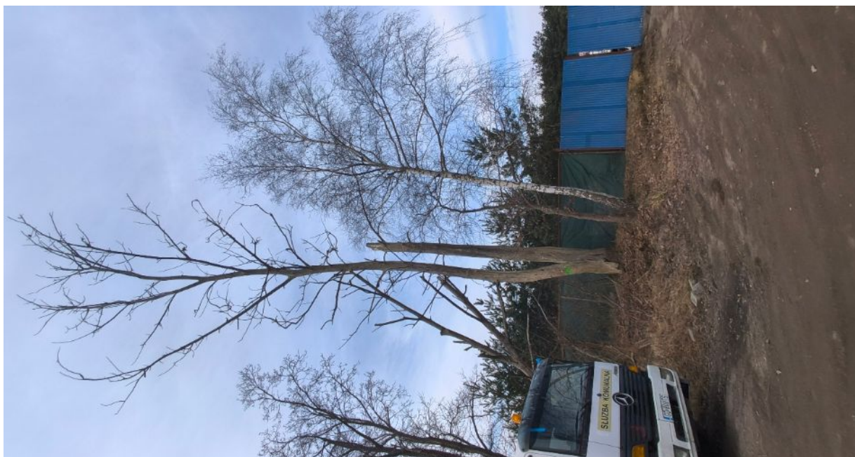
Dokumentacja fotograficzna drzewa nr 2