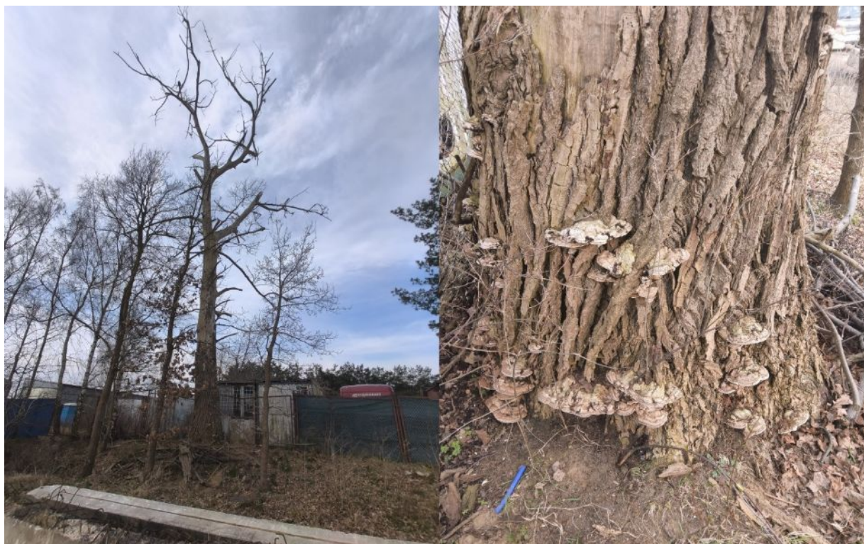
Dokumentacja fotograficzna drzewa nr 1