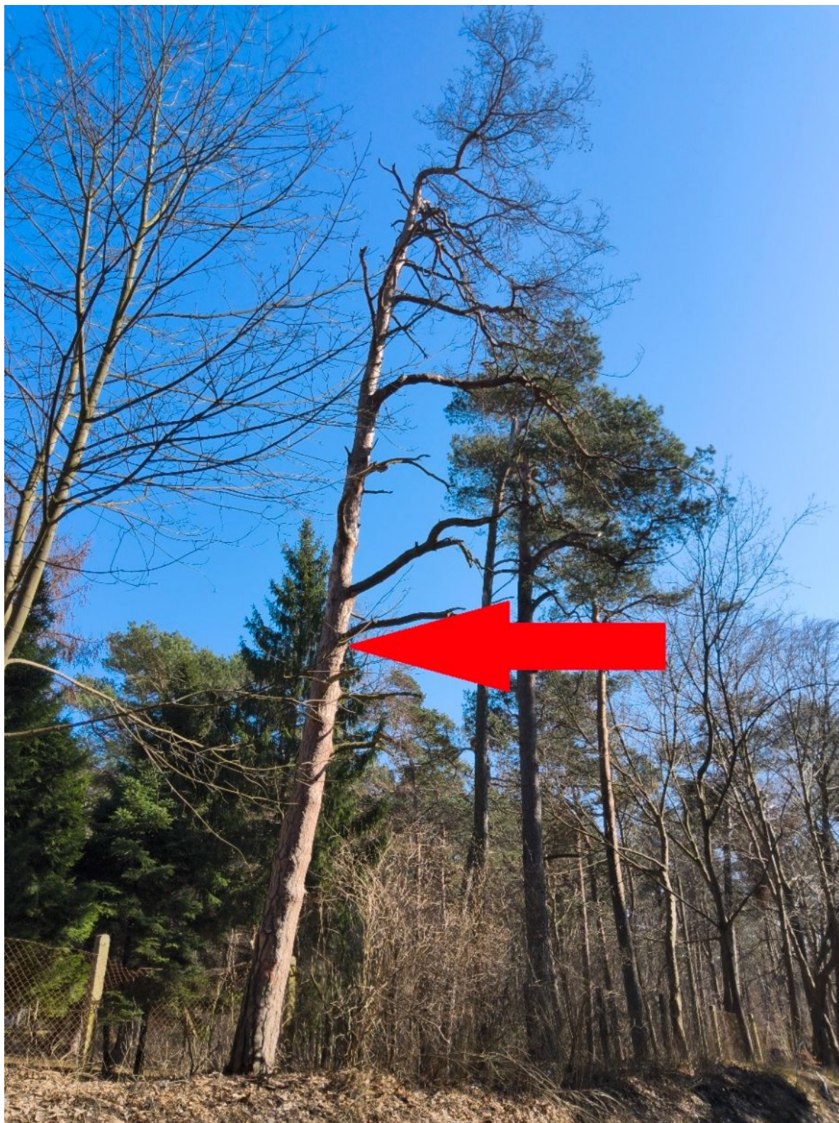
Fotografia nr 1 – sylwetka drzewa nr 1.