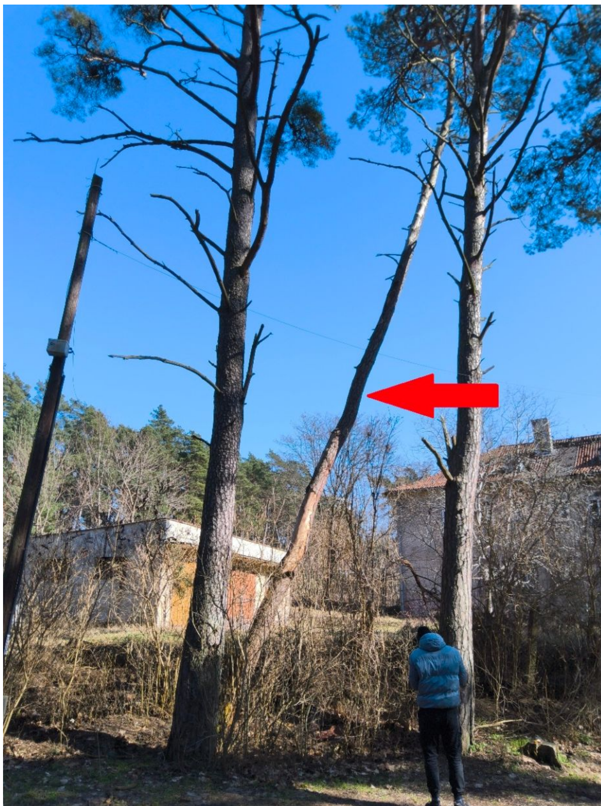
Fotografia nr 2 – sylwetka drzewa nr 2.