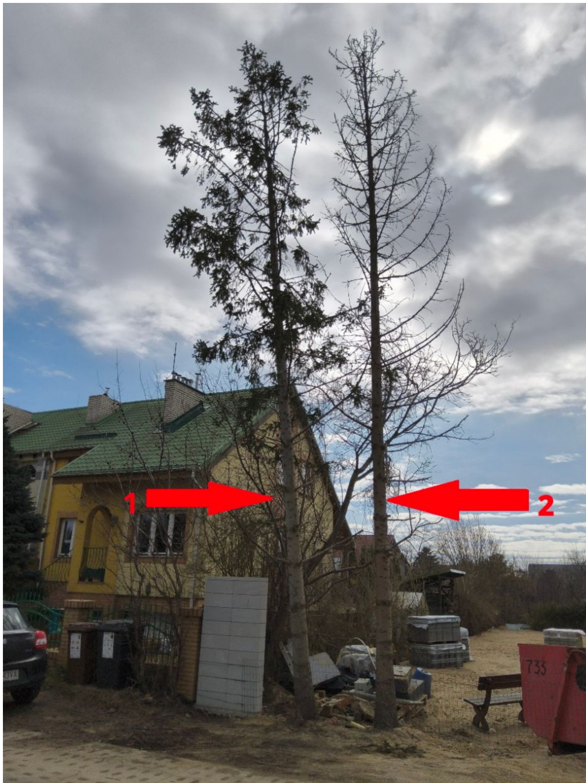
Fotografia nr 1 – sylwetka wnioskowanych drzew od nr 1 do nr 2.