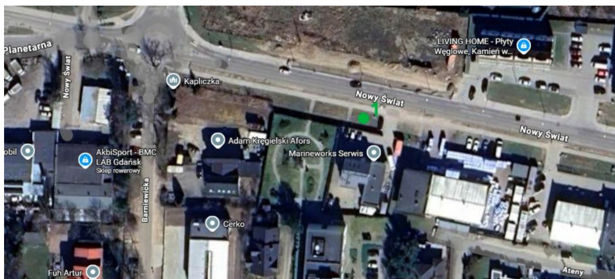
Lokalizacja drzewa do nasadzenia.