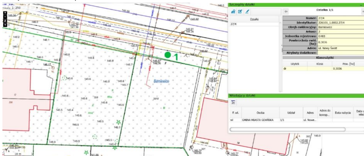
Plan nasadzeń zastępczych – 1 szt. drzewa z gatunku kasztanowiec czerwony ( Aesculus × carnea ).