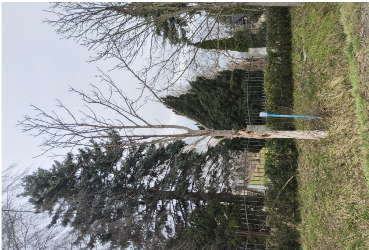
Dokumentacja fotograficzna drzewa nr 1