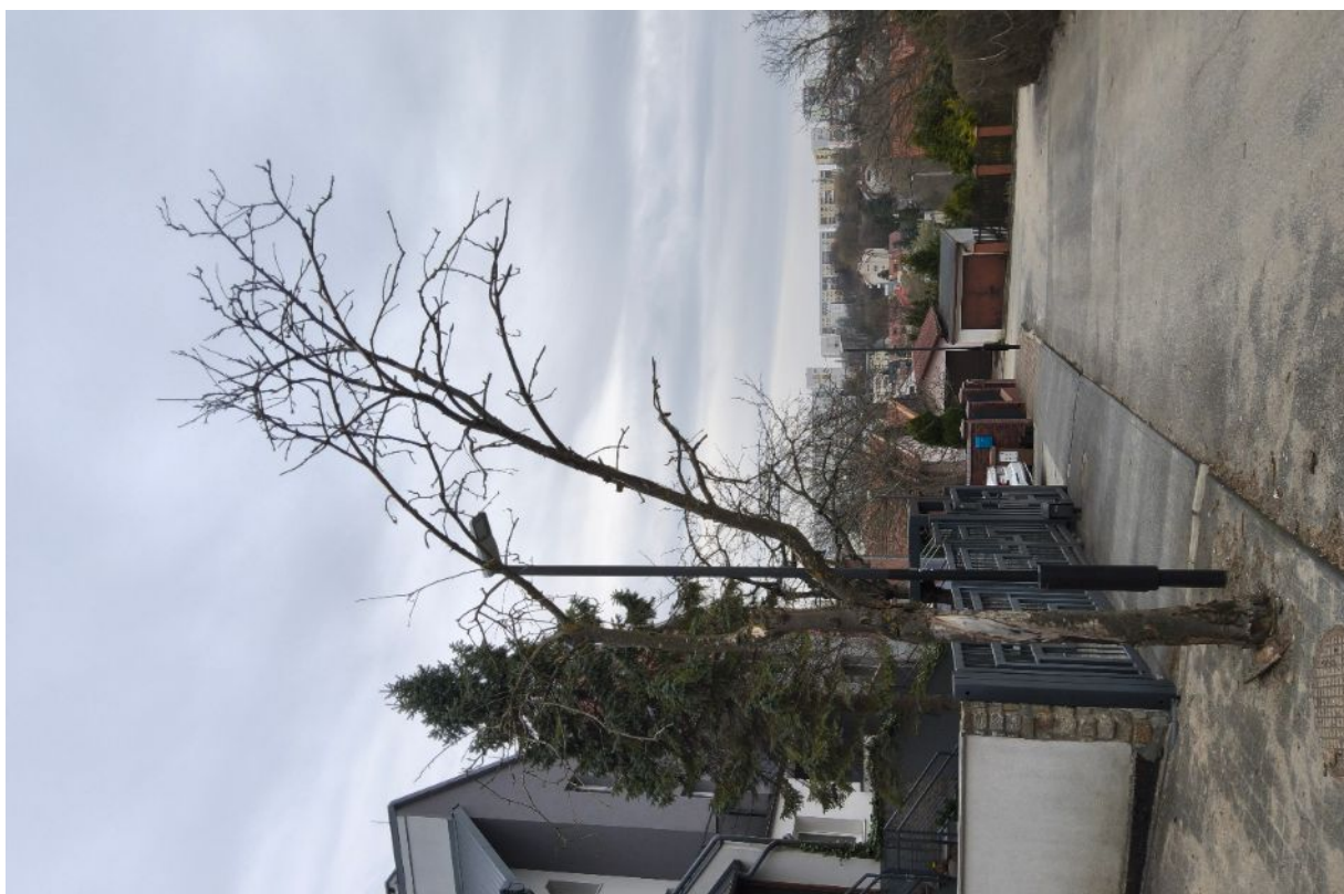
Dokumentacja fotograficzna drzewa nr 1