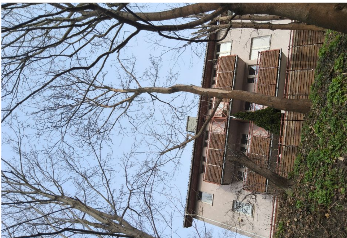
Dokumentacja fotograficzna drzewa nr 1