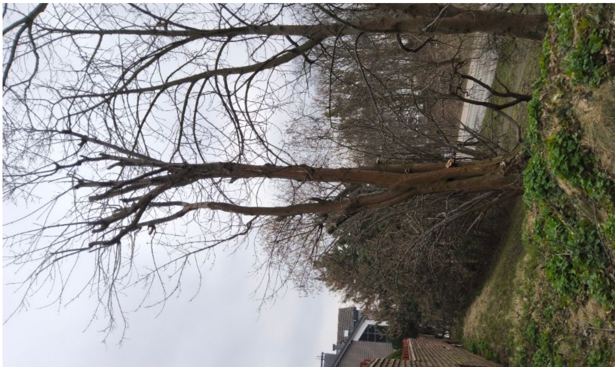
Dokumentacja fotograficzna drzewa nr 2