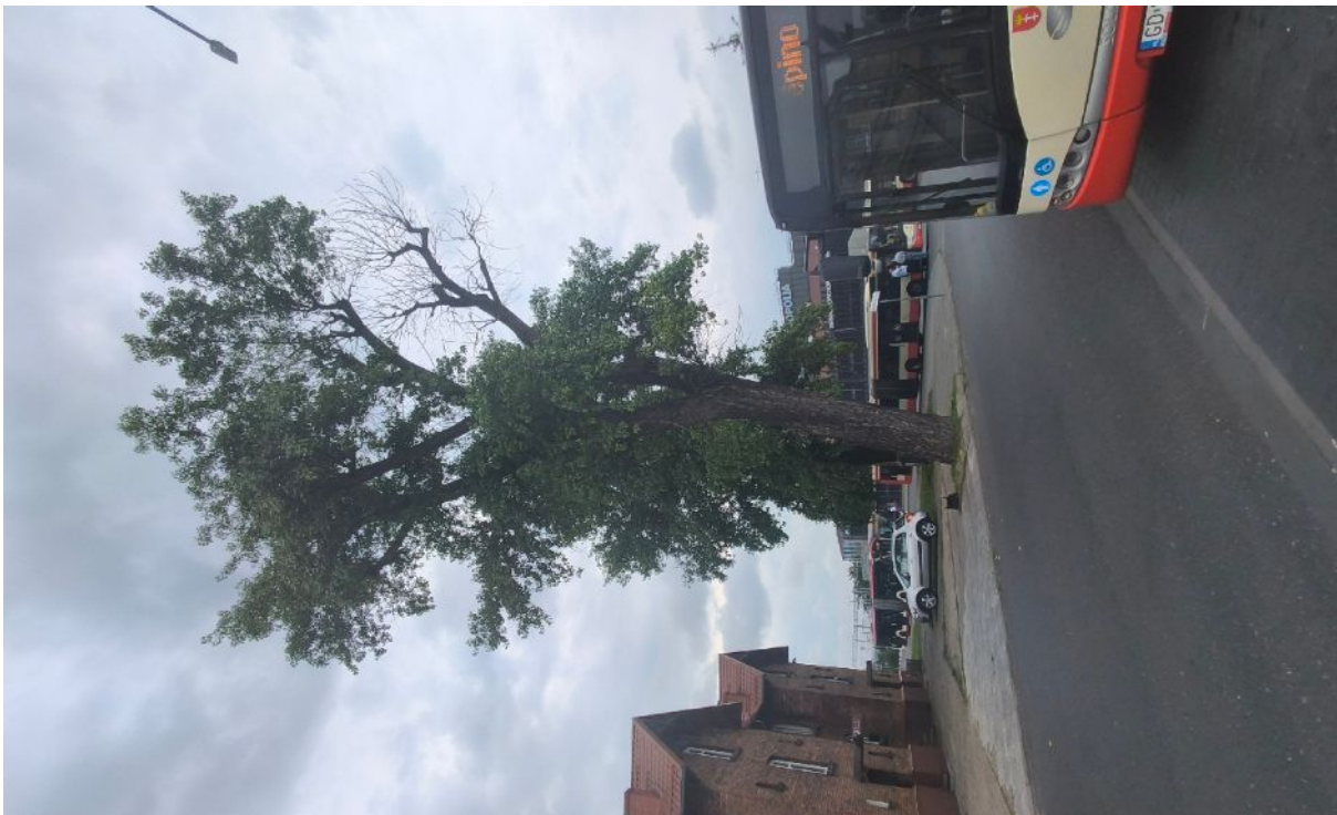
Dokumentacja fotograficzna drzewa