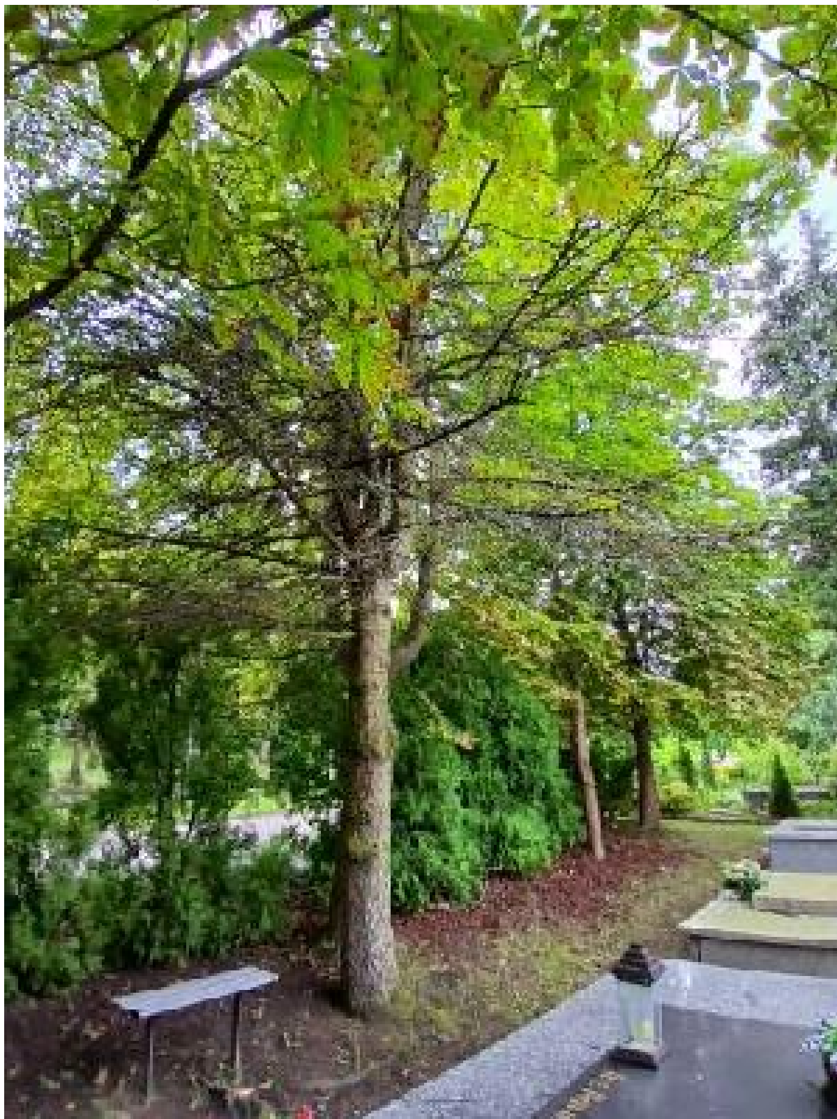
Dokumentacja fotograficzna drzewa

Załącznik nr 2 do pisma nr PD.5102.26.2026.MSt