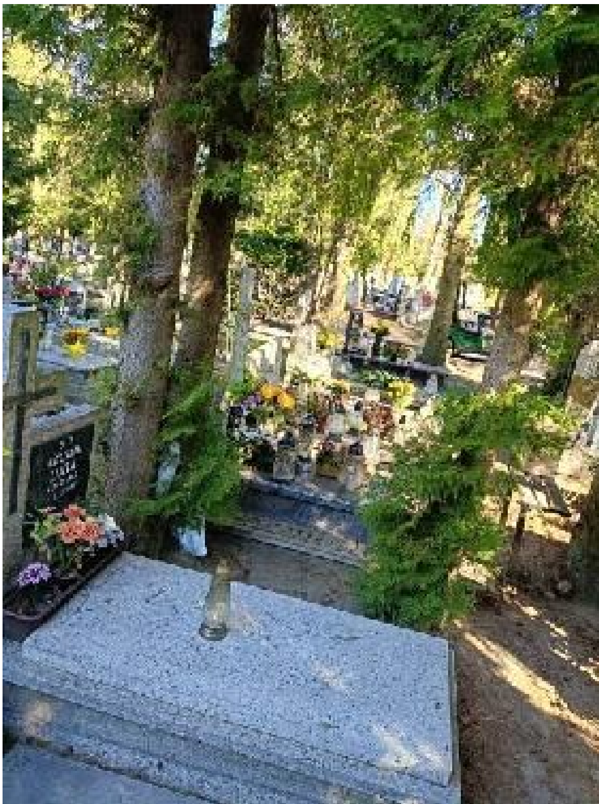
Dokumentacja fotograficzna drzew – c.d.