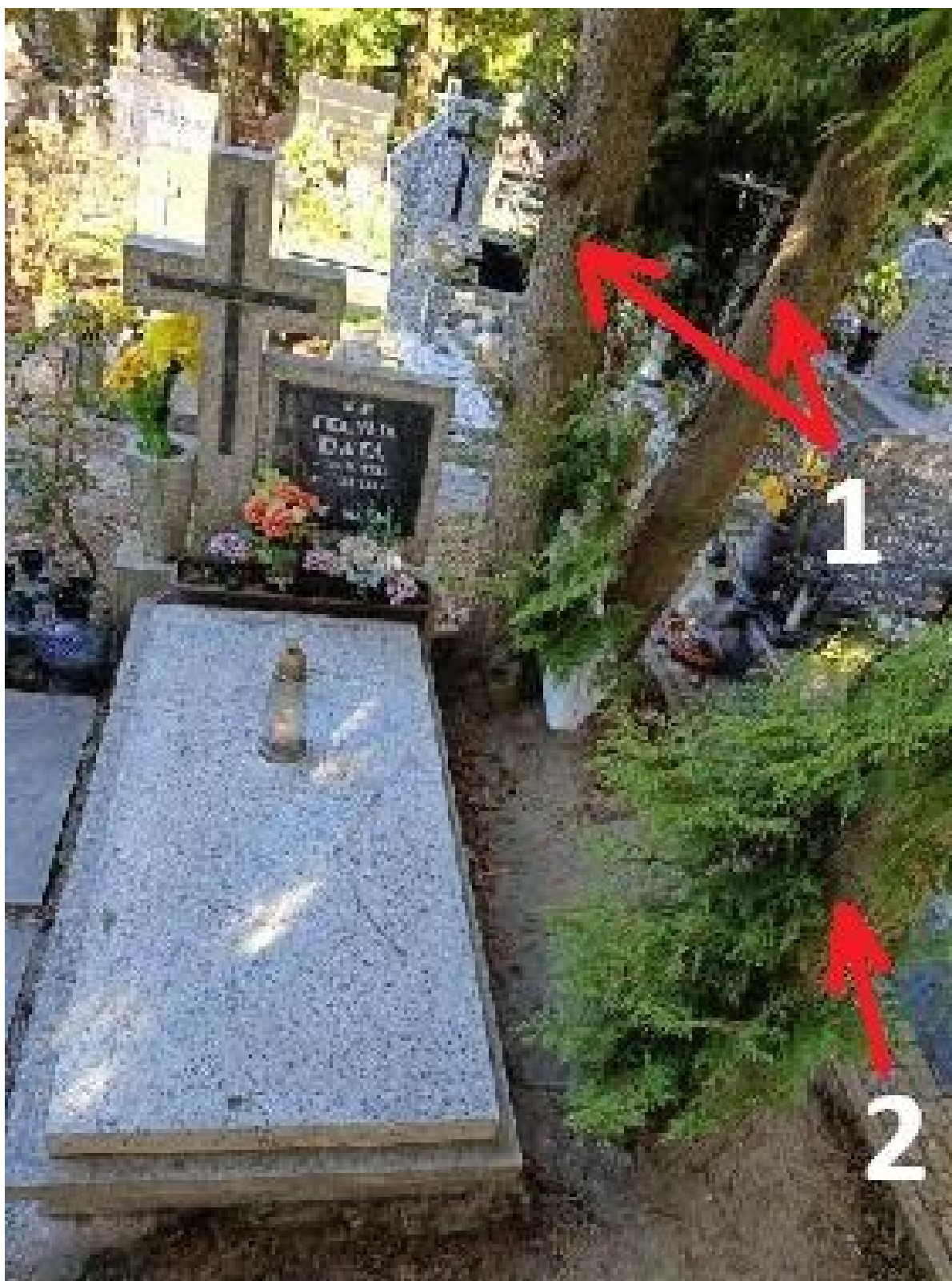
Dokumentacja fotograficzna drzew – c.d.