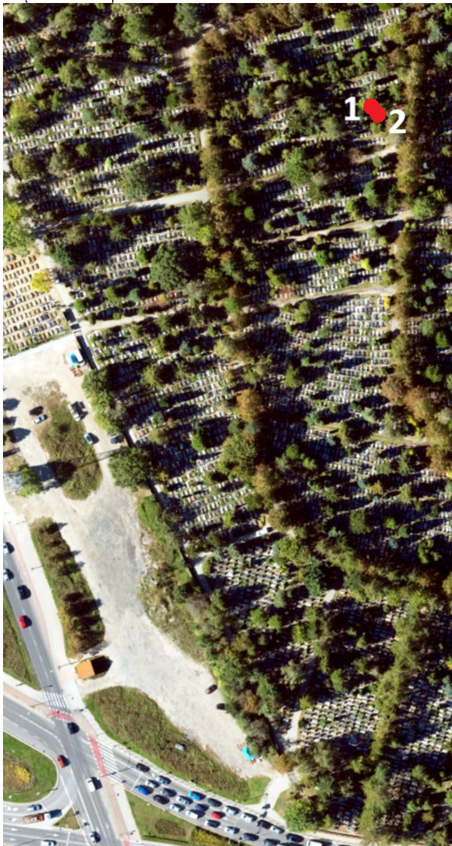
Lokalizacja drzew do usunięcia – Cmentarz Łostowicki