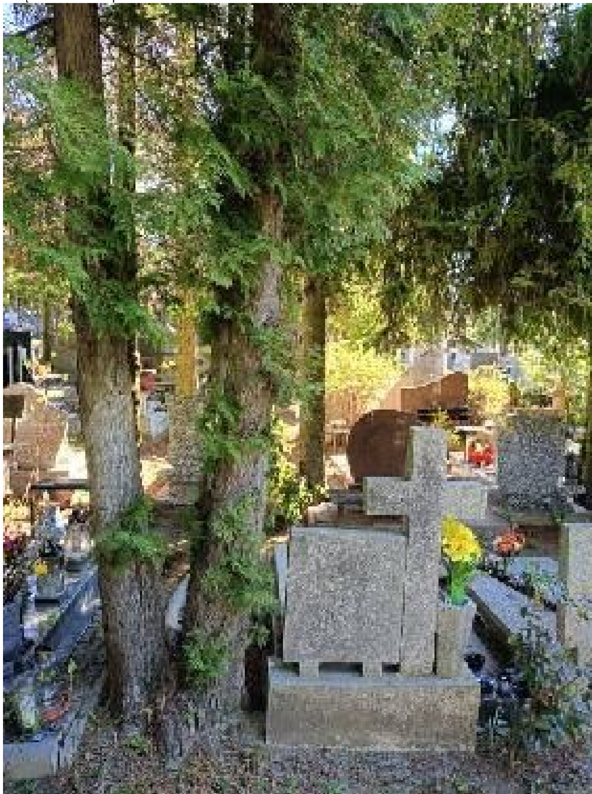
Dokumentacja fotograficzna drzew