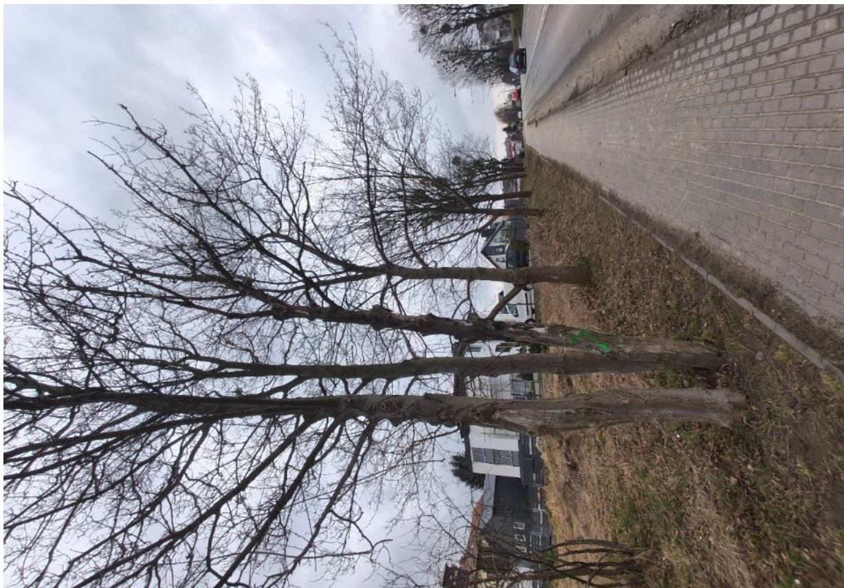
Dokumentacja fotograficzna drzewa nr 2