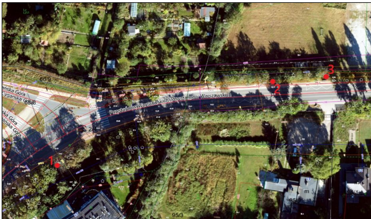
Mapa 1 -lokalizacja drzew ul. Powstańców Warszawskich 41-45