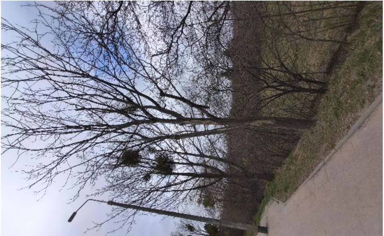
Dokumentacja fotograficzna drzewa nr 2