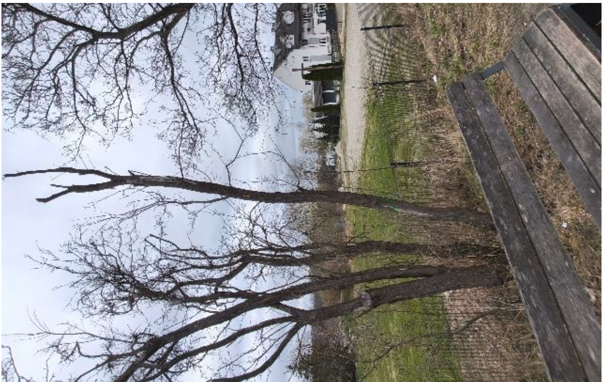
Dokumentacja fotograficzna drzewa nr 3