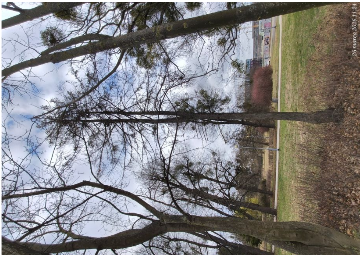
Dokumentacja fotograficzna drzewa nr 1