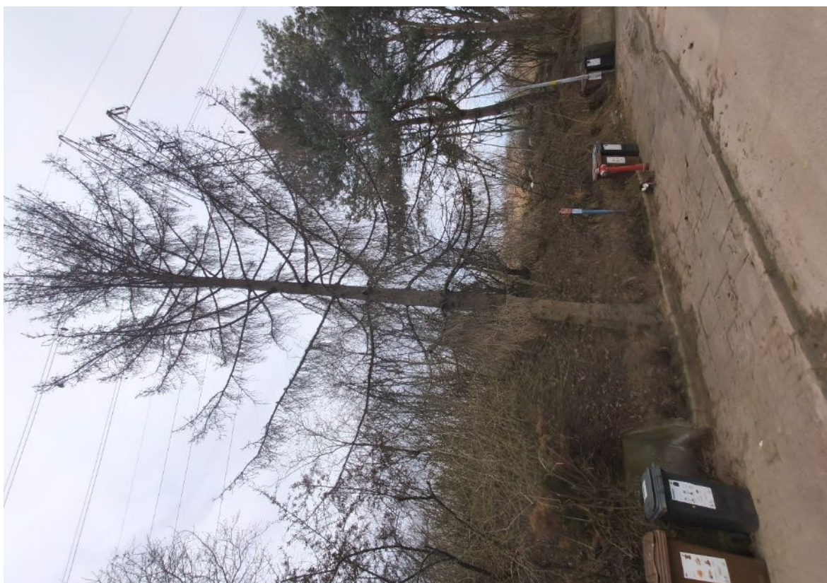
Dokumentacja fotograficzna drzewa