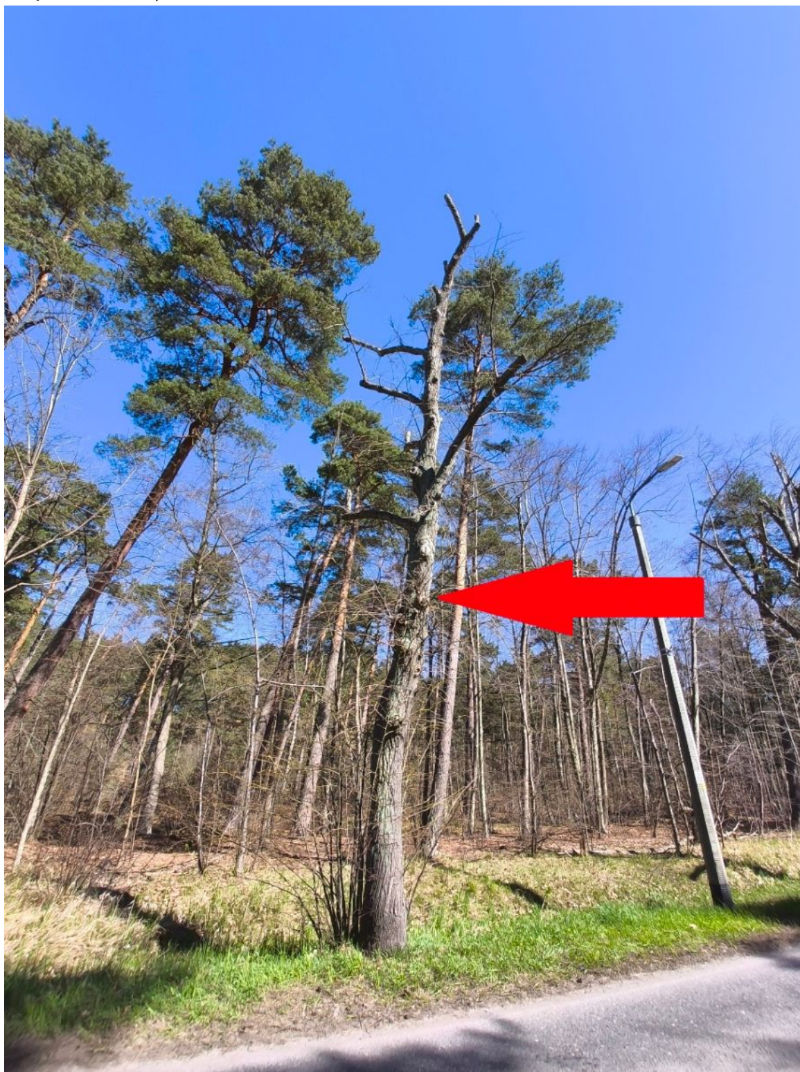
Fotografia nr 1 – sylwetka drzewa nr 1.