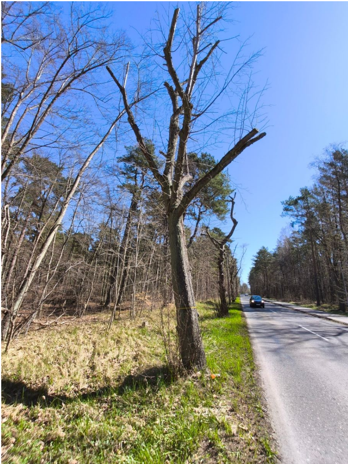
Fotografia nr 2 – sylwetka drzewa nr 2.