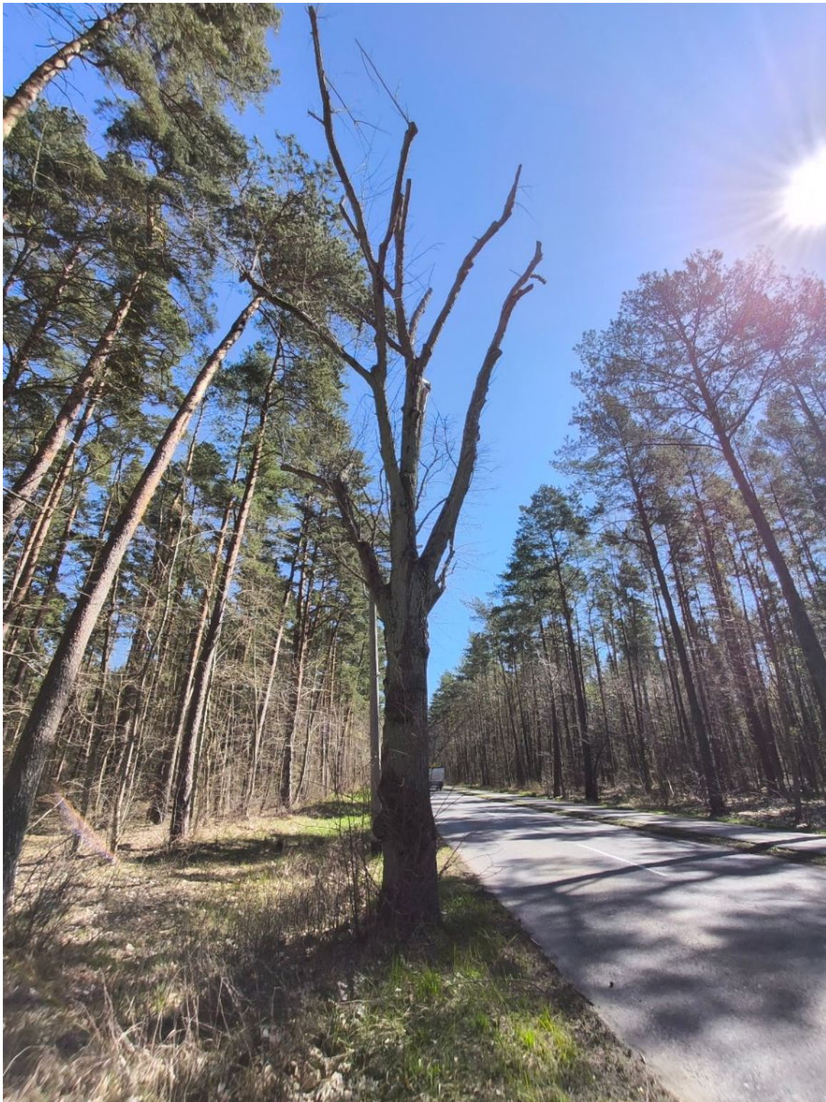
Fotografia nr 3 – sylwetka drzewa nr 3.