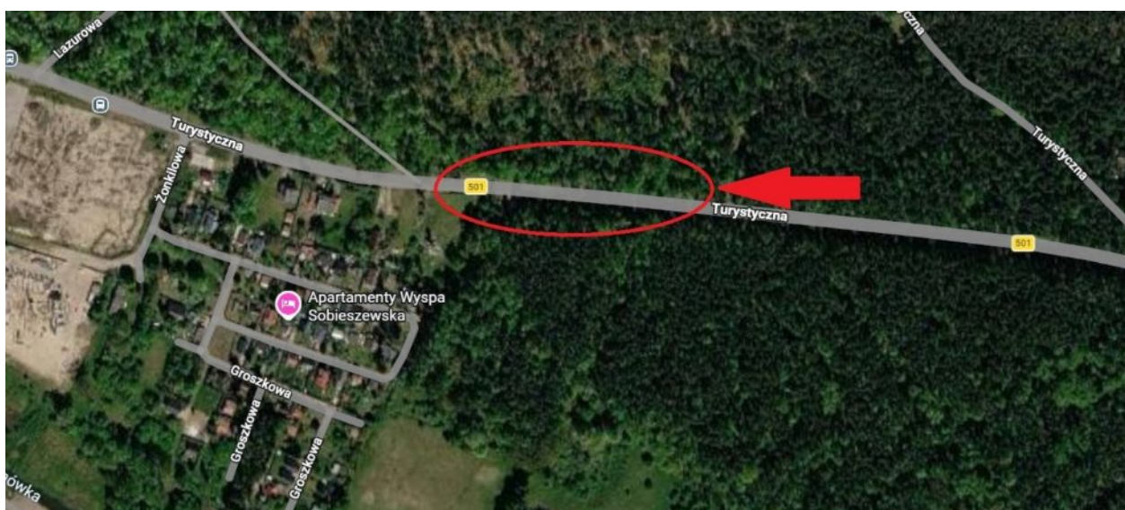
Mapa - lokalizacja wnioskowanych drzew do usunięcia.