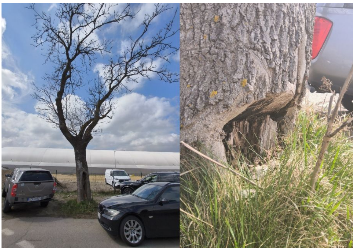
Dokumentacja fotograficzna drzewa