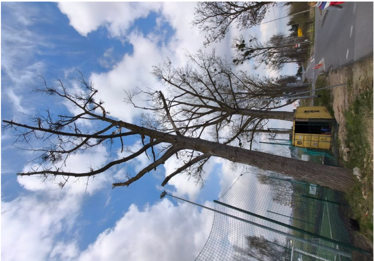
Dokumentacja fotograficzna drzewa nr 2