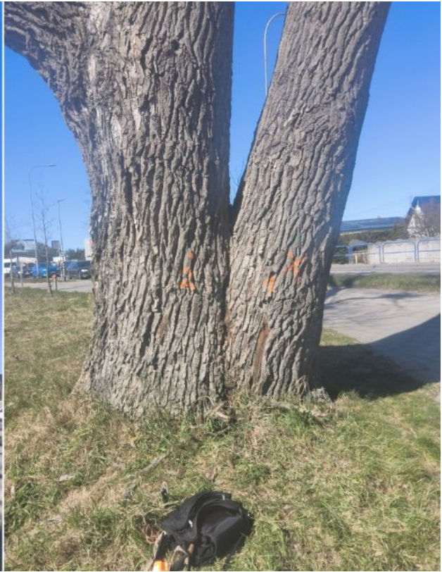
Dokumentacja fotograficzna drzewa nr 1