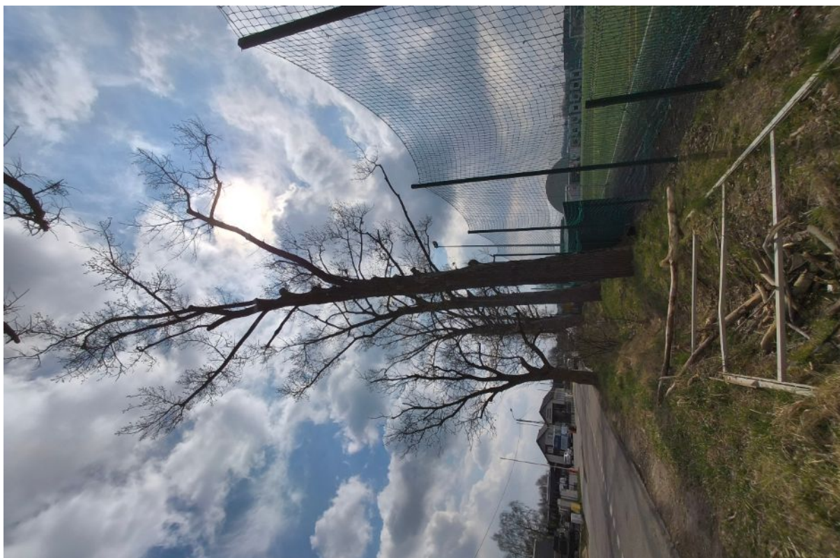
Dokumentacja fotograficzna drzewa nr 3