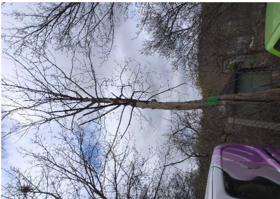
Dokumentacja fotograficzna drzewa