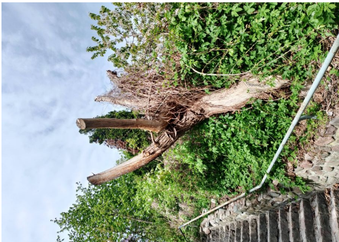
Dokumentacja fotograficzna drzewa