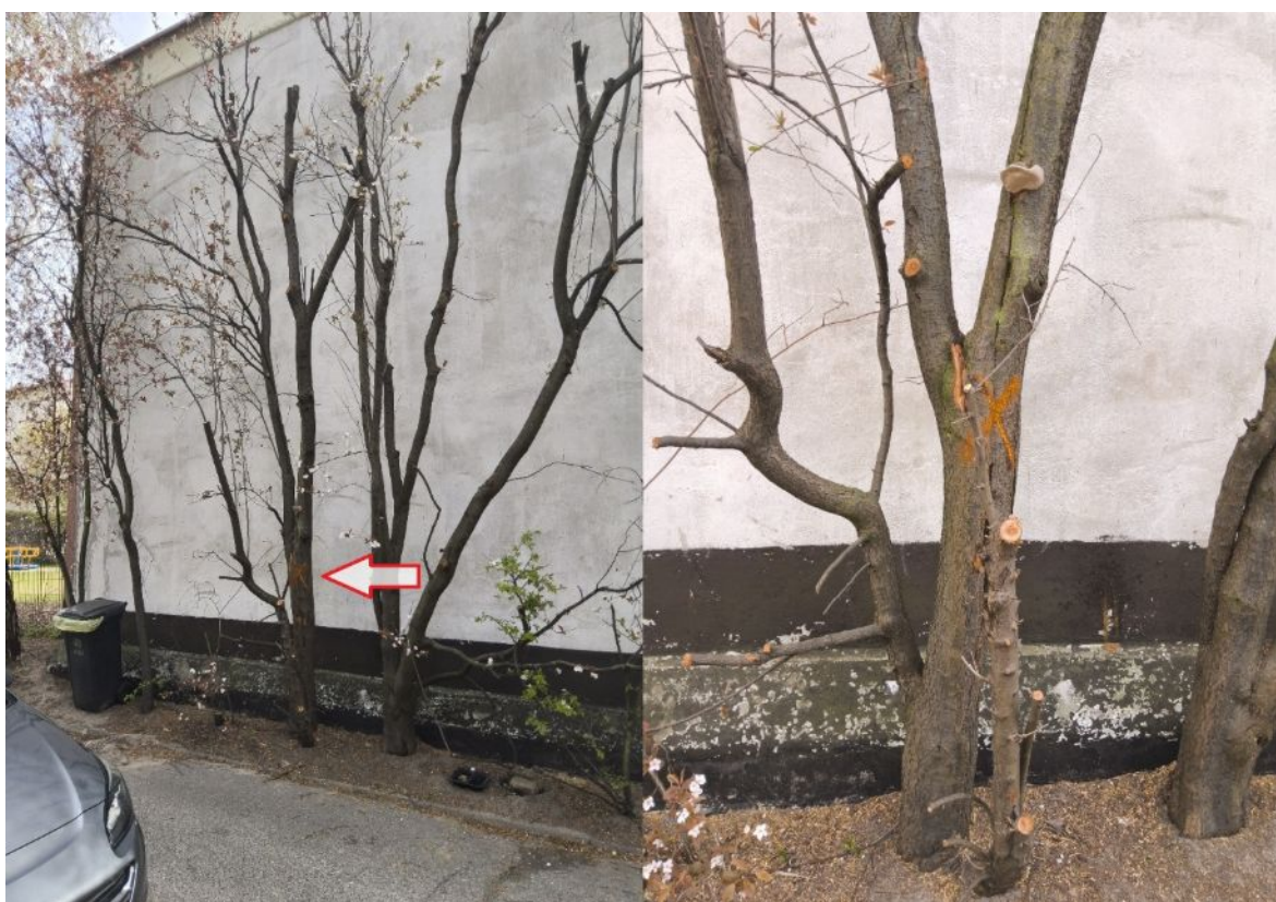
Dokumentacja fotograficzna drzewa