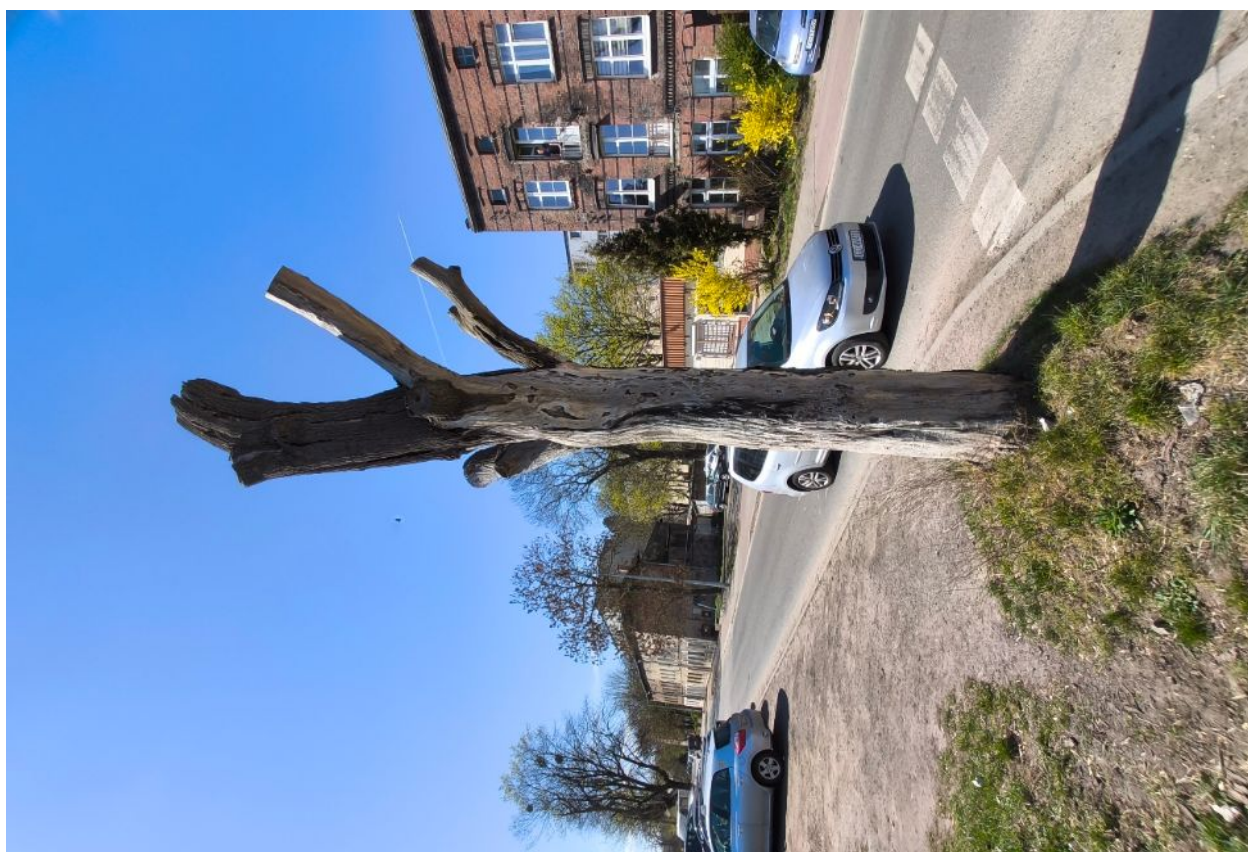
Dokumentacja fotograficzna drzewa