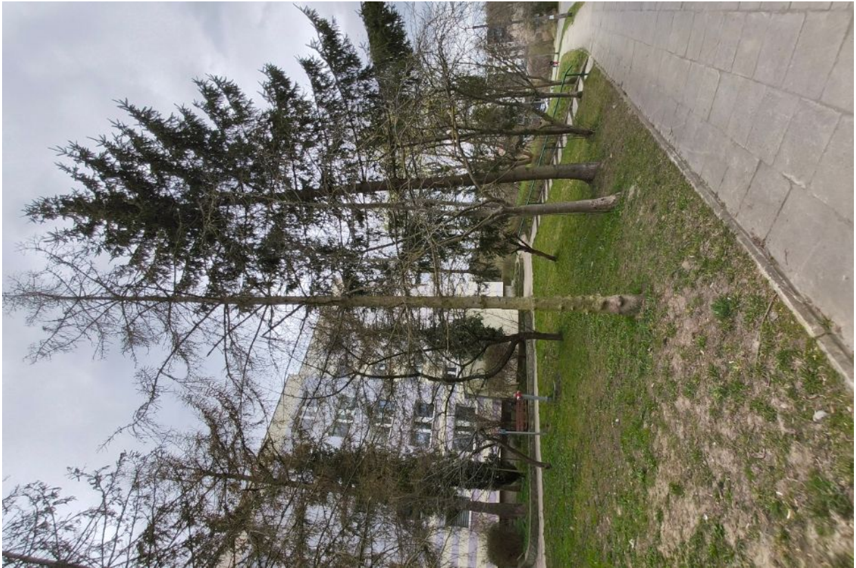
Dokumentacja fotograficzna drzewa nr 2