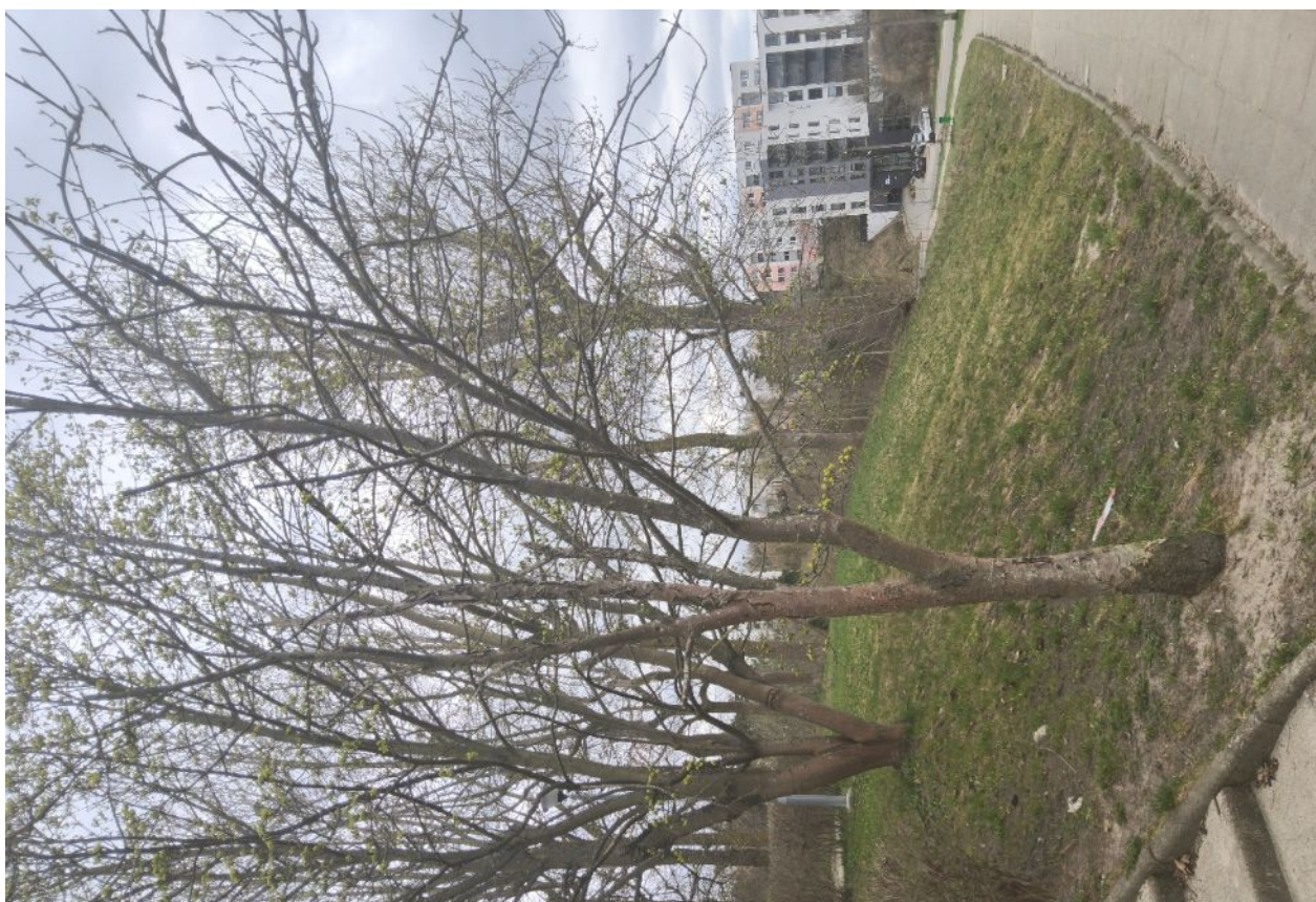
Dokumentacja fotograficzna drzewa nr 1