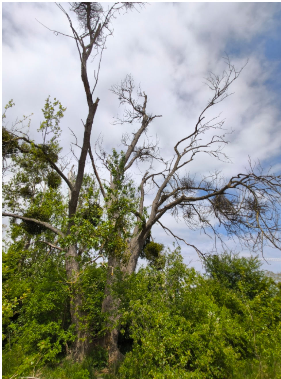
Dokumentacja fotograficzna drzewa.