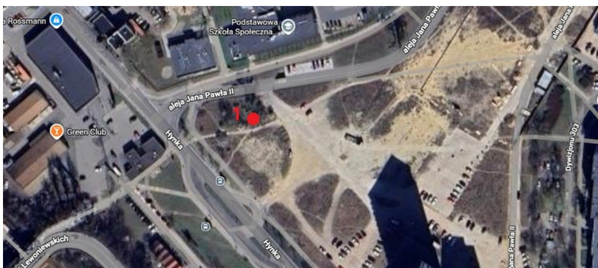
Lokalizacja wnioskowanego drzewa do usunięcia.