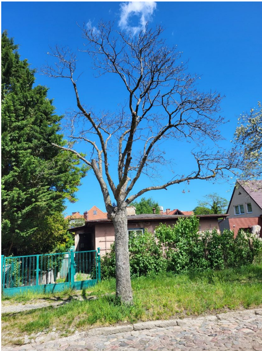
Fotografia nr 1 - sylwetka wnioskowanego drzewa.